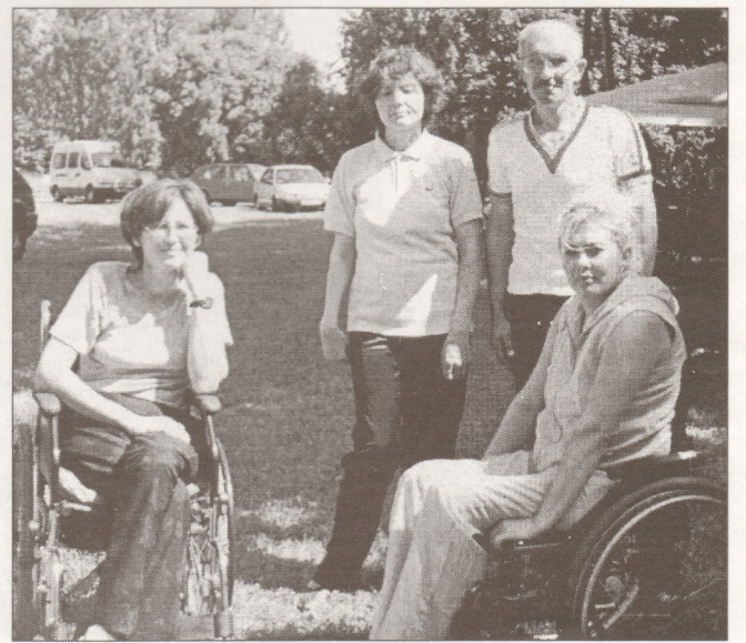
Izraušānās no "četrām sienām" – diena svaigā gaisā.

Jau nākošā dienā – 22. augustā Cēsu stadionā notika Vidzemes novada invalīdu sporta spēles. Salaspils invalīdi bija ieradušies šeit, lai parādītu savas prasmes. No Francijas bija atbraukuši 12 invalīdi, kuri sacentās kopā ar pārējiem dalībniekiem. Labus rezultātus mūsējie sasniedza šausanā, šautriņu mešanā, šķiviņu mešanā. Invalīdu biedrību vadītāji sacentās zābaka mešanā, kur no deviņiem sāncenšiem ieguvu 3. vietu. Pa-