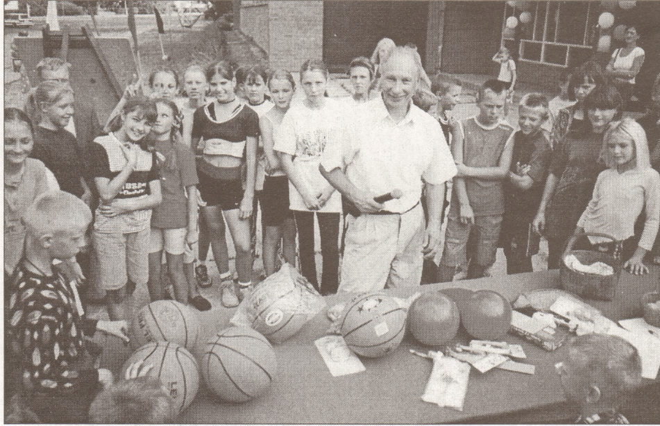
Labākajiem sportotājiem šogad bija sarūpēts bagātīgs balvu fonds.