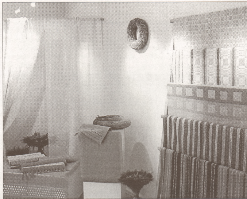
Tautiskās segas, lins un floristika vienkopos izstādē "Ieaustā vasara".