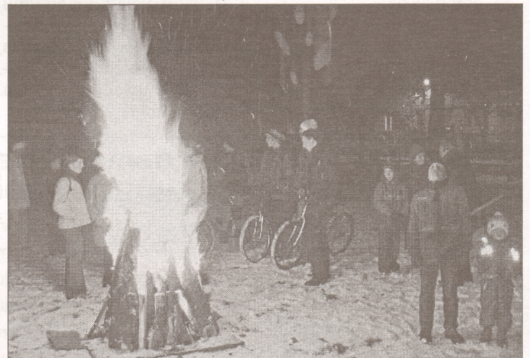
Piemiņas ugunskurs ap sevi pulcē salaspiliešus.

Lāpu liesmas kā gaismas upe noslēdzās pie kultūras nama "Rīgava", kur piemiņas bridī, degot ugunskuram, skanēja tautā populāras dziesmas - "Zilais lakatiņš", "Es karā(i) aiziedams", "Karavīri bēdājās" un melodijas no rokoperas "Lāčplēsis" Artūra Manguļa