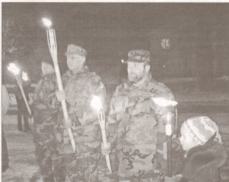
Zemessargi lāpu gājiena priekšgalā.

un kultūras nama "Rīgava" jauktā kora izpildījumā.