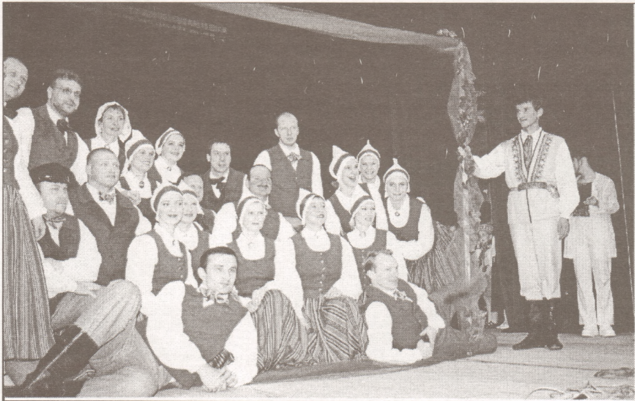
Pirms koncerta katrs kolektīvs sevi pasniedza kā "bildi" improvizētā rāmī. Vidējās paaudzes deju kolektīva "Ūsa" pieteikums.

Vidējās paaudzes deju kolektīva "Ūsa" dalībniece