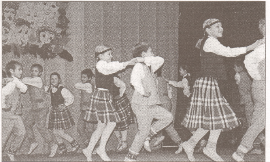
Deju kolektīva "Sienāzītis" baltā grupa izpilda deju "Zirdziņi".

viņa burvīgās darbinieces ar ziediem, pieņemtas veltēm un īpaši sagatavotiem priekšnesumiem. Skaļās ovācijas izpelnījās deju grupas "Buras" un vidējās paaudzes deju kolektīva "Ūsa" sagatavotie "mājasdarbi". Patīkamu un asprātīgu vakara gaisotni radīja Valdis Artavs un pieaicinātie mūziķi. Par to, vai 35. gadi ir daudz vai maz, vakara gaitā domas dalījās. K/n "Rīgava" jubileja nosvinēta, lai piepildās visi vēlējumi un daudz radošu izpausmju tālākajā darbībā! S