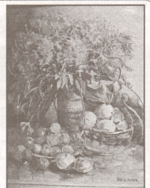
R. Kļesneres glezna "Rudens dārzs".

Plašāk par citiem svētku pasākumiem – skat. 4. lpp. 5