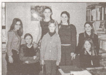
"Ēnu dienas" dalībnieces.

Skola ir viena no tām mācību iestādēm, kas palīdz skolēniem izvērtēt profesijas izvēles motīvus, piedāvā iepazīties ar dažādiem priekšstatiem par profesijas izvēli. Tāpēc arī 13.martā tika organizēta "ēnu diena", kuras mērķis bija rosināt skolēnu interesi pēc iespējas vairāk uzzināt par karjeras iespējām, veicinot pozitīvu attieksmi pret jebkuru darbu. Šāda veida metodi – būt kopā visu dienu ar kādu no pieaugušajiem cilvēkiem viņa darba vietā un darba laikā, izmēģinājām šogad pirmo reizi. Tāpēc arī skolēnu skaits un klases, kuras piedalījās, bija ierobežots. Paldies klašu audzinātājiem, kuri piedalījās šīs dienas organizēšanā, un iestāžu darbiniekiem, kuri bija