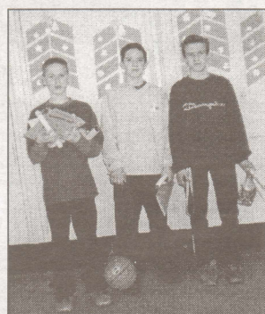
Konkursa "Superpuika 2003" uzvarētāji.

21. martā skolā valdīja neliels satraukums, jo kopā pulcējās veiklākie, atjautīgākie, ziņošākie un aktīvākie 5.-7. klašu zēni, lai piedalītos konkursā "Superpuika 2003." No katras klases tika izvirzīti divi pārstāvji. Konkursa