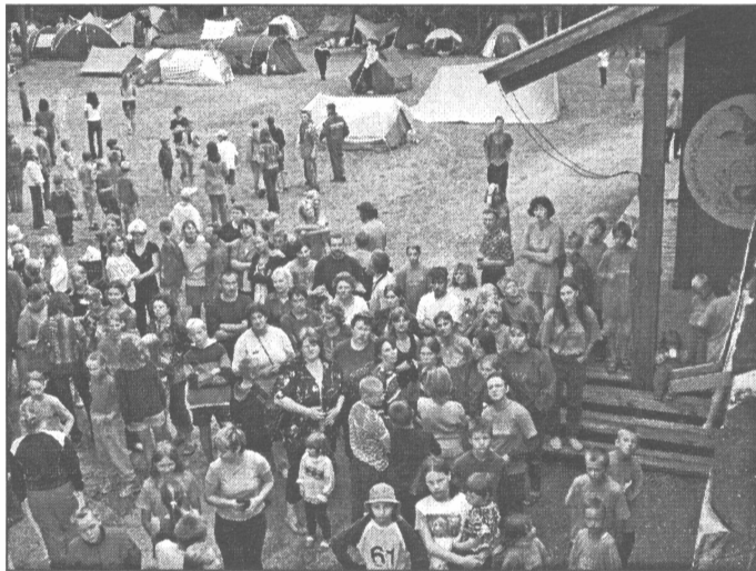
DGB "Mārtiņsala" Igaunijā.

Īpaši gribas atzīmēt rūpes par visu dalībnieku atpūtu un izklaidēm – nepārtraukti tika dota iespēja piedalīties dažādās sportiskās aktivitātēs, sacensībās, radošajās darbnīcās. Savukārt ne tik aktīvie varēja dot priekšroku lais-