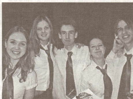
Salaspils 1. vsk. komanda

Katru gadu Salaspils 1. vidusskola organizē Rīgas rajona vidusskolu konkursu "Tādi esam". Arī šis gads nav bijis izņēmums, un kultūras nams "Rīgava" jau ceturto gadu pēc kārtas laipni atvēlēja telpas konkursa rīkošanai. Šogad konkursā piedalījās sešas rajona skolas – Ādažu vidusskola, Salaspils 2. vidusskola, Vangažu vidusskola, Krimul-