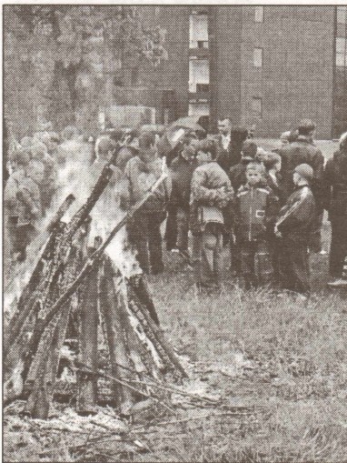
Tradicionālais Ģimenes dienas ugunskurs Zaķusalā