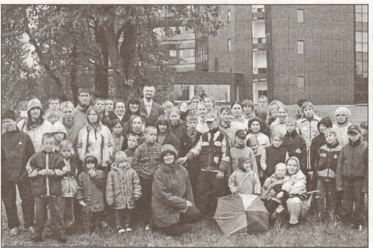
Daudz bērnu ģimeņu biedrība "Mārtiņšala" ar Īpašo uzdevumu ministru Bērnu un ģimenes lietās Ainaru Baštīku

Kad lietus bija pierimis, ģimenes aicināja pie Latvijas