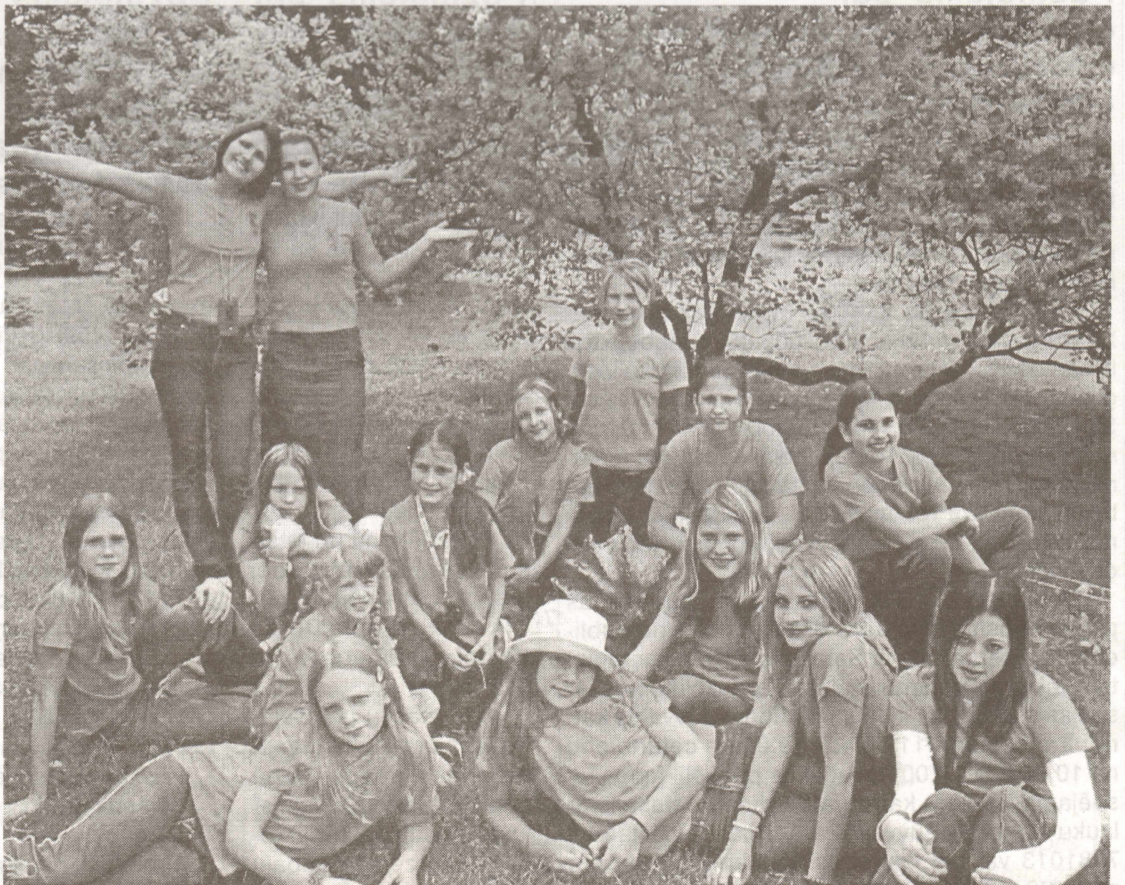
Popgrupa “Smīns” Daugavas muzejā.