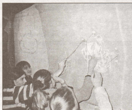
Ēnu teātra aizkulises - pasaka "Zemnieks un viņa kungs"

Projekta mērķis bija rosināt bērnus vairāk lasīt pasakas. Vēlējos, lai lasot izdotos saredzēt, cik pārsteidzoši vienādi sižeti ir tik attālu reģionu tautu mākslai un parādīt, ka dziļas, filozofiskas domas var