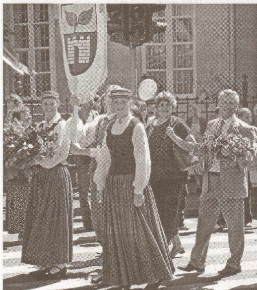
Salaspils novads svētku gājienā.