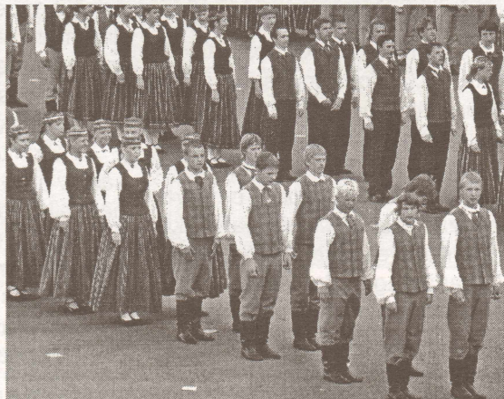
Deju kolektīvs "Austriņš" lielkoncertā "Ritums", veidojot mazu daļiņu no skaistajiem zīmējumiem. S