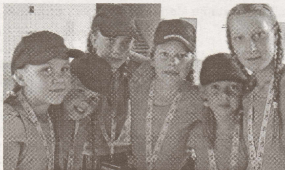
Salaspils 1. vidusskolas deju kolektīva "Dzīpariņš" meitenes Skonto stadionā mēģinājumu laikā.