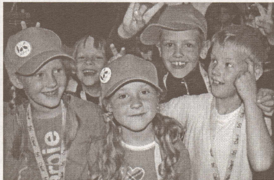
Kultūras nama "Rīgava" deju kolektīva "Sienāzītis" mazie dejotāji starp mēģinājumiem Skonto hallē.