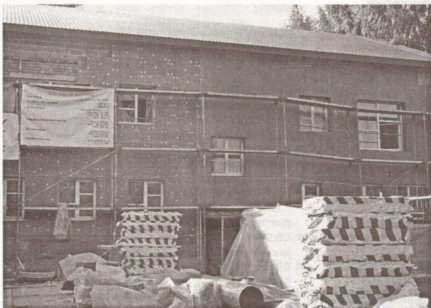
PII "Daugaviņa" ēkas siltināšana un jauna jumta seguma uzlikšana.