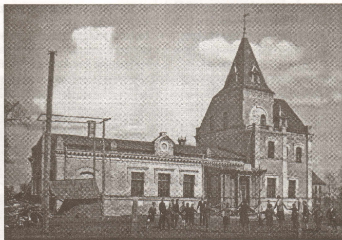
Doles pamatskola muižas kungu namā 20. gs. 20 gadi.

Šķiet, ka Latvijā nebūs viegli atrast otru muižu, kas vārda tiešajā nozīmē atrodas uz salas, taču Doles muiža nekad nav bijusi izolēta – kādreiz tā bija ciešāk saistīta ar Ķekavu, kur joprojām atrodas Doles draudzes baznīca, šodien – ar Salaspili otrā Daugavas krastā. Un, lai mēs ikdie-