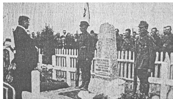
Pieminekļa atklāšana Salaspilī kritušajiem igauņu karavīriem. 1929. g.

LR Zemes reformas laikā tiek sadalītas Salaspils un Doles muižu zemes. Bijušo Salaspils muižas centru un cara armijas nometņu teritoriju turpina izmantot LR armija. Doles muižas centrā ierīko Doles 4-klasīgo pamatskolu (skola tur pastāv līdz 1952.g.)