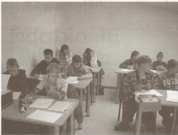
15 bērni veiksmīgi nokārtoja eksāmenu un saņēma velosipēda vadītāja apliecības.

Vispatīkamākais pārsteigums velobraucēja apliecības ieguvējiem – piedalīšanās izlozē. Tajā tika izlozēta velokivere, velosipēda atslēga, zvaniņi, bet galvenā balva bija lielisks Superior velosipēds.