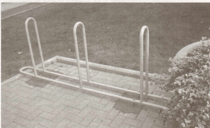
Pie kultūras namiem un 1.vidusskolas ir uzstādīti sešvietīgi velostativī.