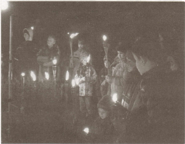
Salaspilieši atzīmē Lāčplēša dienu, dodoties svētku gājienā no Salaspils 1. vidusskolas līdz Vecajiem kapiem.

Pēc svinīgā piemiņas brīža k/n "Rīgava" bija iespēja noskatīties latviešu vēsturisko filmu "Rīgas sargi", kas ir uzņemta par 1919. gada novembra notikumiem Rīgā. Skatīties gribētāji izrādījās krietni vien vairāk, nekā vietu kultūras namā, tādēļ filmu varēja noskatīties arī 18. novembrī.