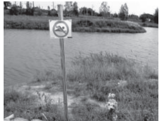
Pagaidu peldēšanās aizlieguma zīmes pie diķiem. D. Ļaha