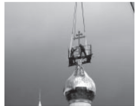
Celtnieki uzstāda iesvētīto krustu uz kupola