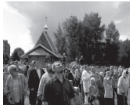
Draudzes locekļi vēro krusta uzlikšanu