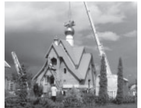
Jaunā pareizticīgo baznīca

© Salaspils Vēstis Izdevējs – Salaspils novada dome Līvzemes iela 8, Salaspils, LV – 2169 Iznāk mēneša 1. un 3. nedēļas piektdienās. Laikraksts internetā: www.laikraksti.lv, www.salaspils.lv