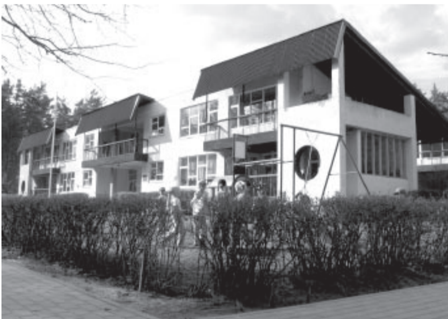
Salaspils sākumskola.