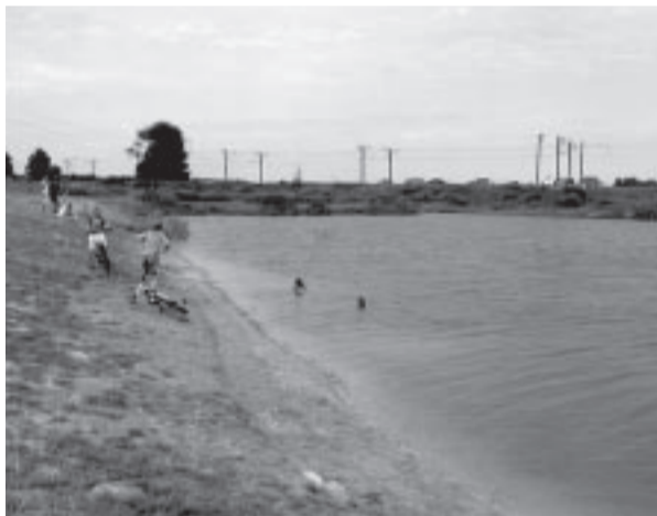
Bērni peldas Nometņu ielas diķos. D. Ļaha

Lolita Trukšāne, sabiedrisko attiecību speciāliste