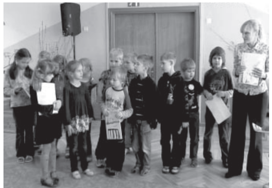
Sākumskolas bērni projektu nedēļā. D. Ļaha