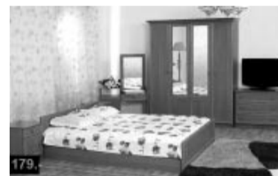
Guļamistabas iekārtas komplekts 179,-