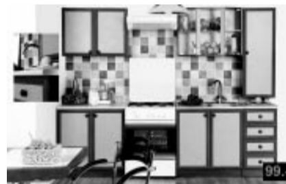
Virtuves iekārta 2.0 m 99,-