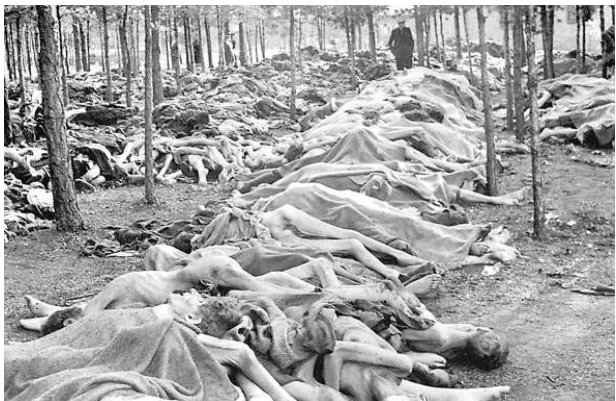
Трупы сваленные в Берген-Бельзен концлагере после того, как британские войска освободили лагерь 15 апреля 1945 года. Британцы обнаружили 60 000 мужчин, женщин и детей, умерших от голода и болезней.

Когда стал приближаться фронт, в концлагере разра-