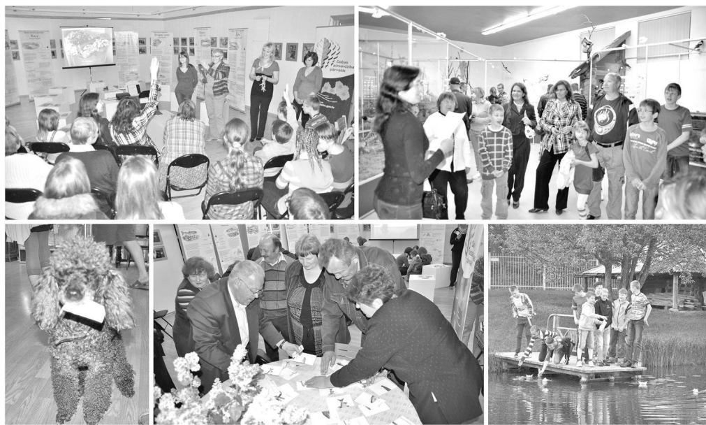
S. Rimšas fotokolāža

du miklas, zīmēja īpašās zivis, lika puzzles, veidoja kuģītus, meklēja zivju nosaukumus. Daudzas interesantas lietas par zilās krāsas klātbūtni dabā literatūrā un mūzikā uzzināja jautājumu-atbilžu kon-