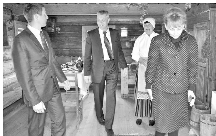
Министр обороны осматривает экспозицию под открытым небом Лудзенского краеведческого музея

А. Пабрикс принял участие в открытии выставки Лудзенского краеведческого музея «Ополчение и Юные ополченцы Латвийской Республики. 20 лет в фотографиях».