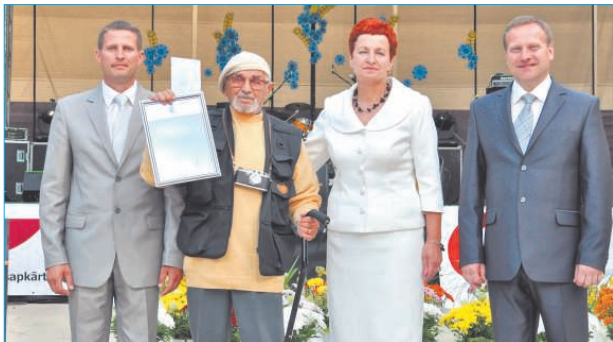
Pirmais Ludzas novada domes apbalvojums „Ludzas novada goda pilsonis” tika piešķirts režisoram, scenāristam, operatoram, fotogrāfam, producentam un kino teorētiķim Hercam Frankam par profesionālu darbību.

Герцу Франку присвоено звание «Почетный гражданин Лудзенского края».