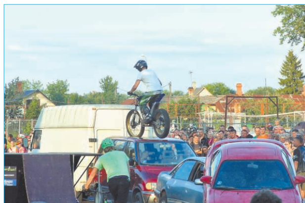
Ar iespaidīgu šovizrādi stadionā „Vārpa” simtiem skatītājus pārsteidza ekstrēmā velo un moto komanda GreenTrials.

Мероприятия мотоклуба «Лielceļa klaidoņи» прошли с большим успехом.