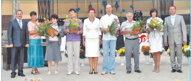
Lai veicinātu Ludzas novada uzņēmēju atpazīstamību un popularizētu labas uzņēmējdarbības prakses piemērus Ludzas novadā, Ludzas novada pašvaldība jau otro gadu rīko konkursu.

„Ludzas novada uzņēmēju gada balva 2012”. Tika godināti uzņēmēji, kuri aktīvi un godprātīgi darbojas savā nozarē, sekmējot uzņēmējdarbības vides attīstību novadā.