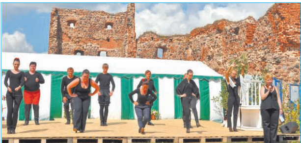
Amatierteātru festivālā „Vurvuleits” uzstājās Siguldas novada Mores pagasta amatierteātris „Oga”, Rudzātu teātra kopa „Okūts” Salnavas Tasutas nama teātramiļi un Žukovskas jauniešu teātra studija „Šest” no Krievijas. Фестиваль любительских театров под открытым небом.

Награждение победителей конкурса «Человек года 2012».