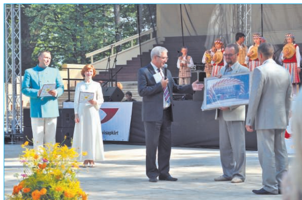
Vieskolektīvu koncertā dzirdējam ārzemju viesu delegāciju sveicienus Ludzai no Lietuvas (Moletu un Rokišķu pašvaldībām), no Baltkrievijas (Novopolocas pilsētas muzikālais kolektīvs „Suzorje”), no Krievijas (Sebežas pilsētas), no Vācijas (Aue pašvaldības), no Bulgārijas (Svištovas pašvaldības). Ludza saņēma arī īpašu lādi ar laba vēlējumiem no motokluba „Lielceļu klaidoņi”.

На променаде вместе с нами был аттрактивный повар, ведущий телешоу Мартиньи Сирмайс.