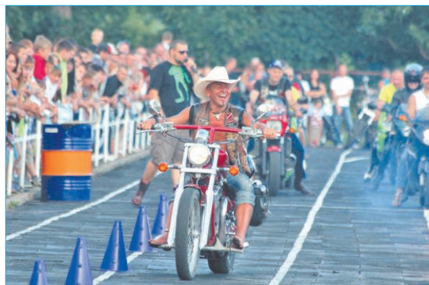
Klaidoņu dienas 2012 ar Ludzas novada pašvaldības atbalstu organizēja motoklubs „Lielceļa klaidoņi” no Rēzeknes. Tas bija aizraujošs, vērienīgs un labi organizēts pasākums.

Концерт и поздравления гостей из городов-побратимов.