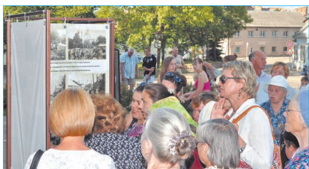
Foto izstādes „Zudusī ... atrastā Ludza” atklāšana. Izstāde būs skatāma četrās pilsētas vietās: pie viesnīcas „Lucia”, skvērā pie viesnīcas „Ludza”, pie Luterāņu baznīcas un pilsētas laukumā.

Открытие фото выставки «Потерянная... найденная Лудза».