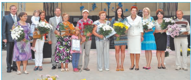
Konkursa „Vasara sētā 2012” uzvarētāju apbalvošana. Награждение победителей конкурса «Лето на дворе 2012».

Награждение победителей конкурса «Предприниматель года 2012».