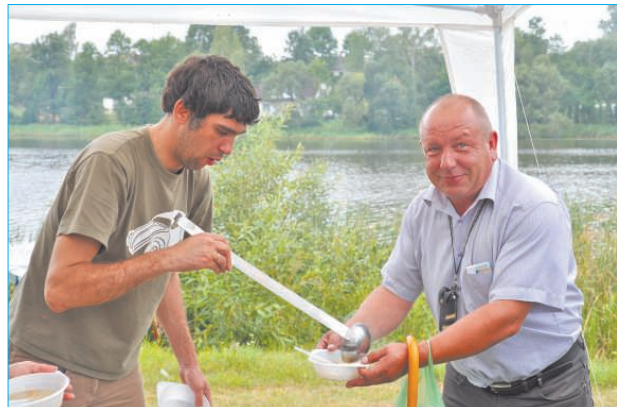
Nobaudījām kulinārā mantojuma ēdienus un dzērienus. Apmeklējām amatnieku tirdziņu, priecājāmies par Ludzas novada folkloras kopu, dejotāji un ārzemju viesu priekšnesumiem.

На променаде вместе с нами был аттрактивный повар, ведущий телешоу Мартиньи Сирмайс.