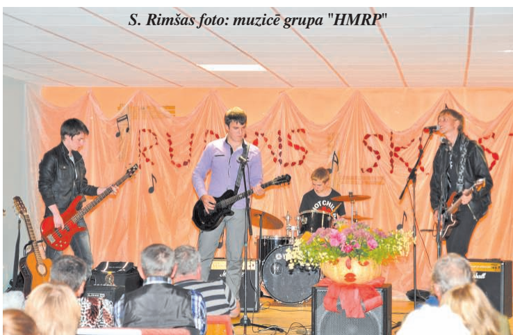
muzicē grupa "HMRP"

22. septembrī Cirmas Tautas nams pulcināja Ludzas novada dziedātājus.