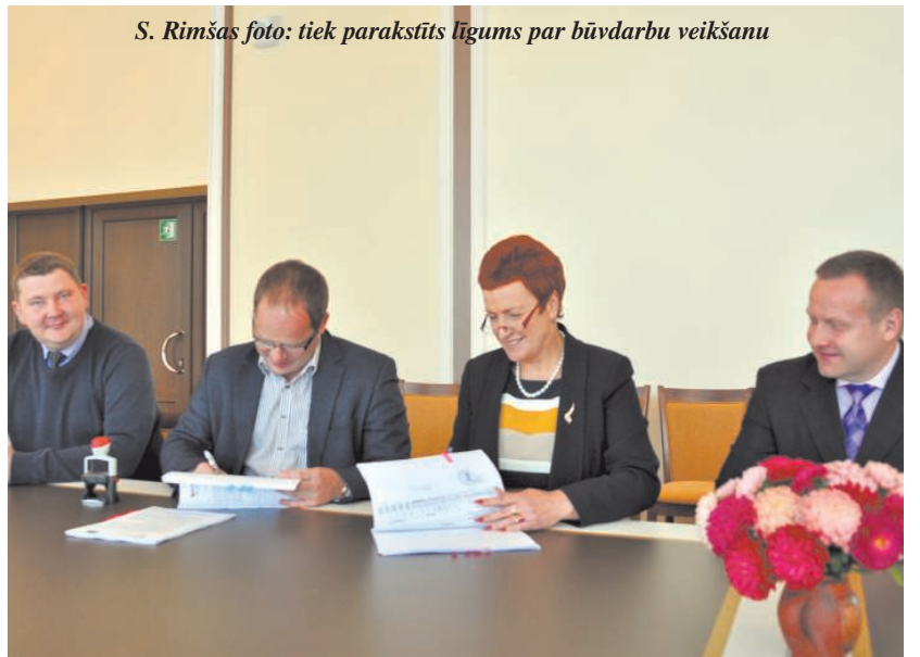
tiek parakstīts līgums par būvdarbu veikšanu