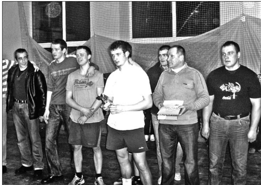
Izturīgie un veiksmīgie uzvarētāji gandarīti par sportiskā noskaņojumā pavadīto dienu.