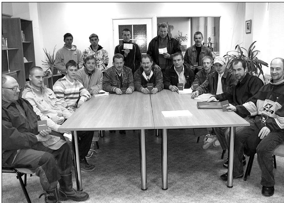
Amatas novada iedzīvotāji pēc apmācības motorzāģa un krūmgrieža vadītājs pabeigšanas un kvalifikācijas dokumentu saņemšanas Skujenē.

* Cismu sadala izstrādes slejās, ja mežizstrādes darbus veic vairāk nekā viens koku gāzējs vai mežizstrādes daudzoperāciju mašīna. Attālums starp blakus strādājošām