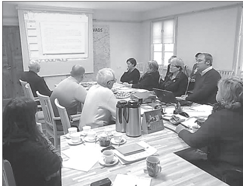
Notiek pārrunas par zaļās enerģijas rīcības plāna izstrādi Amatas novadam.

Zaļās enerģijas rīcības plāns tiek izstrādāts