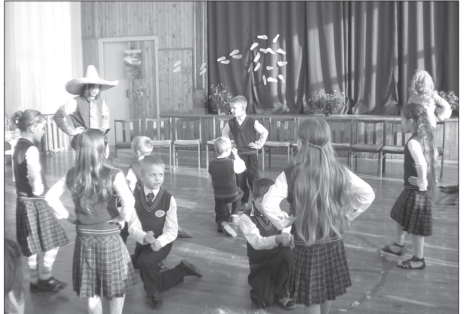
100. dienas svinībās pirmklasnieki dejo tautas dejas.

Ērika Arāja, Amatas pamatskolas direktora vietniece