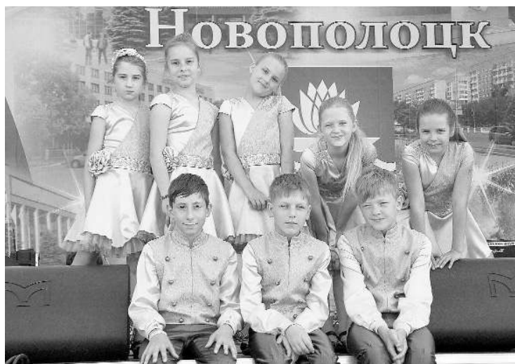
Popgrupa „Cielaviņa” uz lielās Novopolockas svētku skatuves