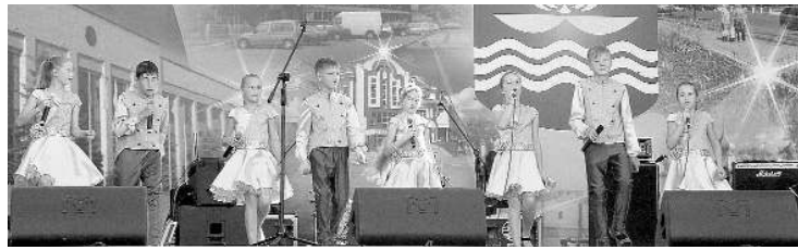
На фото: Поп-группа «Циелавиня» на большой праздничной сцене в Новополоцке