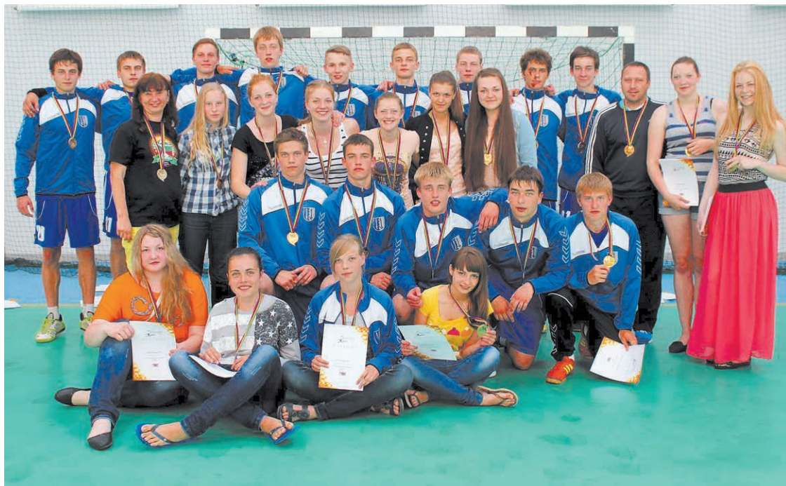
Latvijas čempioni handbolā

12. jūnijā Ventspilī tika svinīgi iedegta Latvijas Jaunatnes vasaras Olimpiādes lāpa. Latvijas Jaunatnes vasaras Olimpiāde notiek reizi divos gados, kur labākie jaunie sportisti sacenšas pašvaldību komandu sastāvos 26 Olimpiskajos sporta veidos, izcīnot ceļazīmi uz Eiropas Jaunatnes Olimpiādi. 1992. gadā Latvijā notika pirmās Latvijas skolu Olimpiskās dienas vasaras sporta veidos.