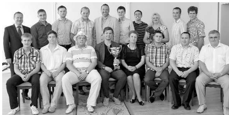
Latvijas čempioni handbolā

Jau otro gadu pēc kārtas par Latvijas handbola čempionāta uzvarētājiem kļūst sporta kluba „Latgols” vīriešu komanda. Izšķirošajā spēlē, tāpat kā pērn „Latgolam” pretī stājās Dobeles komanda „Tenax”. „Latgola” sieviešu komanda Latvijas Handbola virslīgas čempionāta sievietēm šogad atkal izcīnīja bronzu. Lieliskas tradīcijas!