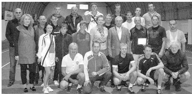
Теннисисты радуются восстановленному корту

7 сентября в манеже Лудзенского спортивного комплекса «Варпа» торжественно был открыт возобновленный теннисный корт.