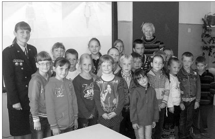
1.-3.klases skolēnu tikšanās ar policijas darbiniekiem

Notika arī individuālās sarunas ar jaunajiem satiksmes dalībniekiem – mopēdu vadītājiem, infor-