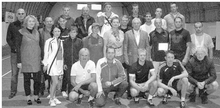
Tenisisti ir priecīgi par atjaunoto kortu

7. septembrī Ludzas sporta kompleksa „Vārpa” manēžā tika svinīgi atklāts atjaunotais tenisa laukums.