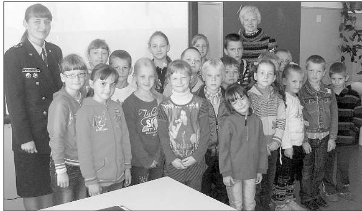
Встреча учеников 1 – 3 классов с сотрудниками полиции

Беседа с учениками 6 – 9 классов, сотрудник полиции обратила внимание учеников на вопрос об употреблении веществ, вызывающих зависимость, и последствиях этого, нарушениях закона и ответственности. Состоялись и индивидуальные раз-