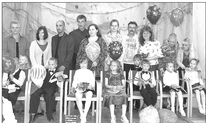
2012./2013. mācību gada pirmklasnieki ar vecākiem.