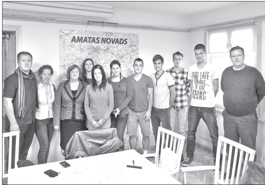
Jauniešu domes veidotāji un Amatas novada vadītāji pārliecināti par veiksmīgu sadarbību nākotnē.

Amatas novada dome 19. septembra domes sēdē pieņēma lēmumu izveidot jauniešu domi, bet pēc jauniešu nevalstiskās organizācijas „Nītaureņi” iniciatīvas jaunieši jau 21. septembrī devās iepazīties ar pagastu pārvaldēm. Jauniešu vēlme bija uzzināt un izprast pārvalžu darbu, sniegtos pakalpojumus un uzzināt kopējo informāciju par pagastos esošajiem jauniešiem.