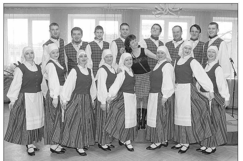
Skujenes dejojāji šī gada skatē Cēsīs.

Visu pastāvēšanas laiku, deju kolektīvs sevi četras reizes ir pārstāvējis Dziesmu un deju svētkos Rīgā. Un, dalībnieki būs arī šogad, jo ieguldītais darbs ir atmaksājies. Daudzi dejojāji uz deju svētkiem dosies jau vairakkārt. Jo ir tādi dejojāji, kas kolektīvā dejo gandrīz no tā dibināšanas, gan arī tādi, kuri no jauniešiem ir pārgājuši uz vidējo paaudzi.