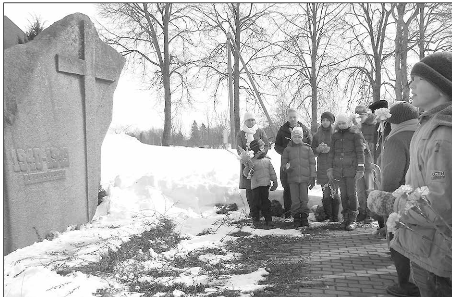
Piemiņas brīdis Zaubē