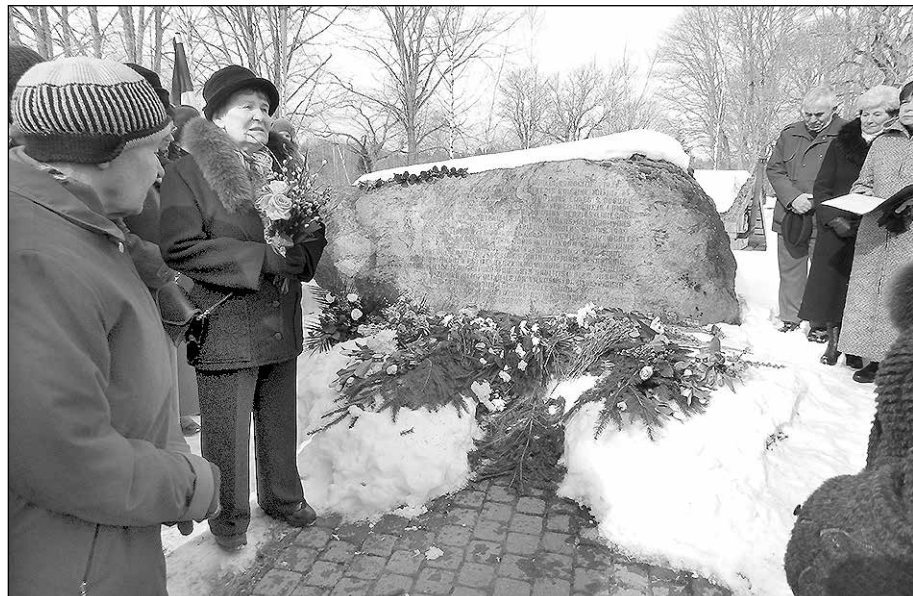
Piemiņas brīdis Amatā