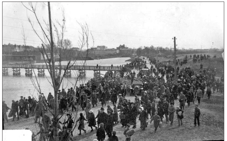
Rīdinieki priecājas par bermontiešu padzīšanu no pilsētas. Bolderāja, 1919. gada beigas.

Par godu Latvijas valsts armijas uzvarai pār Bermonta karaspēku, 11. novembrī atzīmē Lāčplēša dienu — šī diena simbolizē Andreja Pumpura eposā «Lāčplēsis» pareģoto latviešu tautas varoņa Lāčplēša uzvaru pār melno bruņinieku.