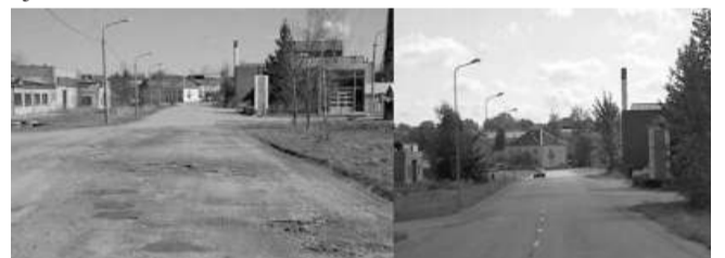
Rūpniecības iela pirms un pēc restaurācijas

Rekonstruēto ielu iedzīvotāji zina, ka darbi nav