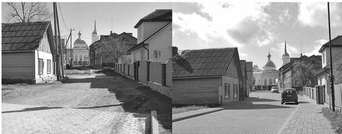
Эзера шкерсиела до и после реставрации