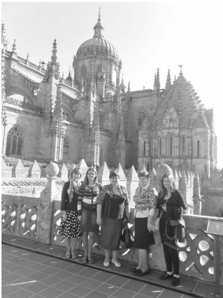
Nirzas pamatskolas Comenius grupa pie Salamankas katedrāles

21. oktobrī Comenius dalībnieki iepazīna Salamanku jeb „zelta pilsētu”, kas iekļauta pasaules kultūras mantojumā ar savu seno vēsturi, grezno arhitektūru, pasaulē vienu no senākajām bibliotēkām. Tika apskatīts Salamankas centrālais laukums Granda Plaza Mayor un pilsētas municipalitātes ēka, Salamankas vecā un jaunā katedrāle. Pilsētā dominē renesanses laika arhitektūra, tās celtniecībā izmantots tikai šim reģionam raksturīgs smilšakmens, kas rada zeltainu nokrāsu.