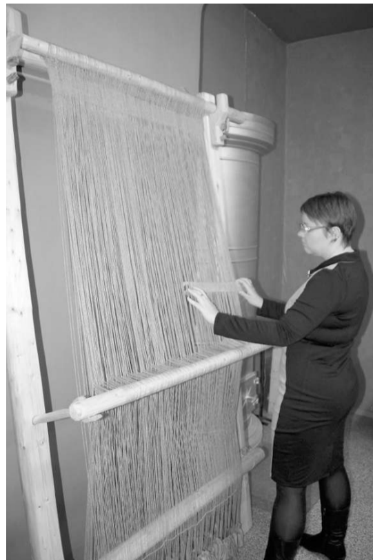
Фото: Каждый посетитель музея может поработать на вертикальном ткацком станке