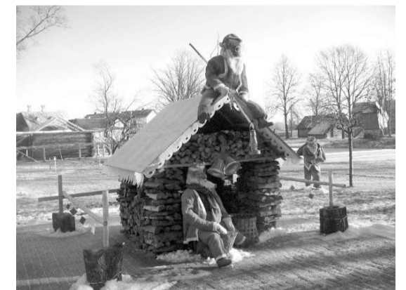
Фото: Рождественский декор на территории Лудзенского Краеведческого музея

Любителей виртуальных путешествий ожидает экскурсия по средневековому замку ливонского ордена, построенному в Лудзе в 1399 году. При помощи информационных технологий с большого экрана экскурсантам открывается панорама грозной цитадели. Одетые в доспехи рыцари пропускают нас в главные ворота, и мы оказываемся в предзамковой части. Цифровая реконструкция возвращает нас во времена расцвета ливонского ордена, когда замковые каменные стены надежно охраняли его восточные рубежи.