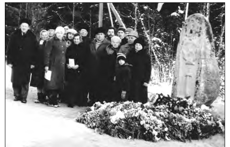
Ieriķieši pieminekļa atklāšanas dienā 1988. gada 11. novembrī.