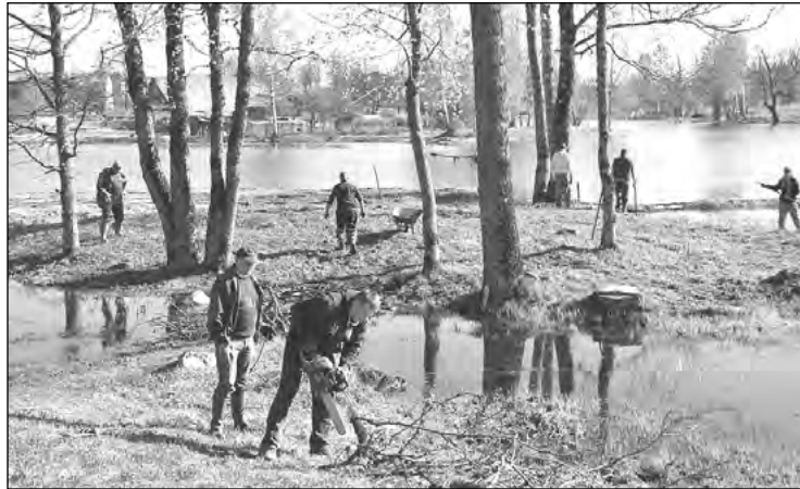
Talka pie Augšezera.