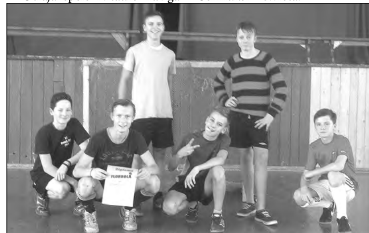
Uzvarētāji – Nītaures komanda.

Finālā Nītaureņi svinēja uzvaru ar 6:1 un izcīnīja pirmo vietu, Zaubes komanda 2.vietā, Sērmūkši – 3.vietā.