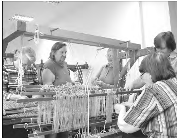
Skujenes pagasta audējas iesaistās velku vilkšanā brunčiem.