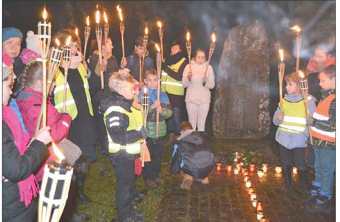
Lāpu gājiens šogad 11. novembrī.

atceras: „Gar pieminekli bija eglīšu rinda. Kad akmens pazuda, cilvēki turpināja paklusām nest ziedus. Braucot uz Cēsīm ar autobusu, paskatījos – jā atkal ir ziedi. Tad eglītes nocirta, lai šo vietu iznīdētu pavisam un kapavietā sāka krāties ceļmalas ūdens. Vairs nebija koku, kas ar saknēm uzsūktu mitrumu. Bet par pieminekļa pazūšanu ir stāsts, ka šūnakmens aizvests uz Igauniju. Toreizējais Cēsu kara komisārs palepojies, ka nakti apturējuši kādu igauņu kravas automašīnu, ievēluši akmeni un piesacījuši, lai aizved labi tālu.”