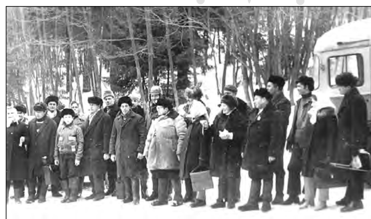
Zemledus makšķerēšanas sacensības uz Lazdiņa ezera ledus, 1970. gads.

1983. gads, kolhoza ziemas sporta spēles. Drabešu inter-