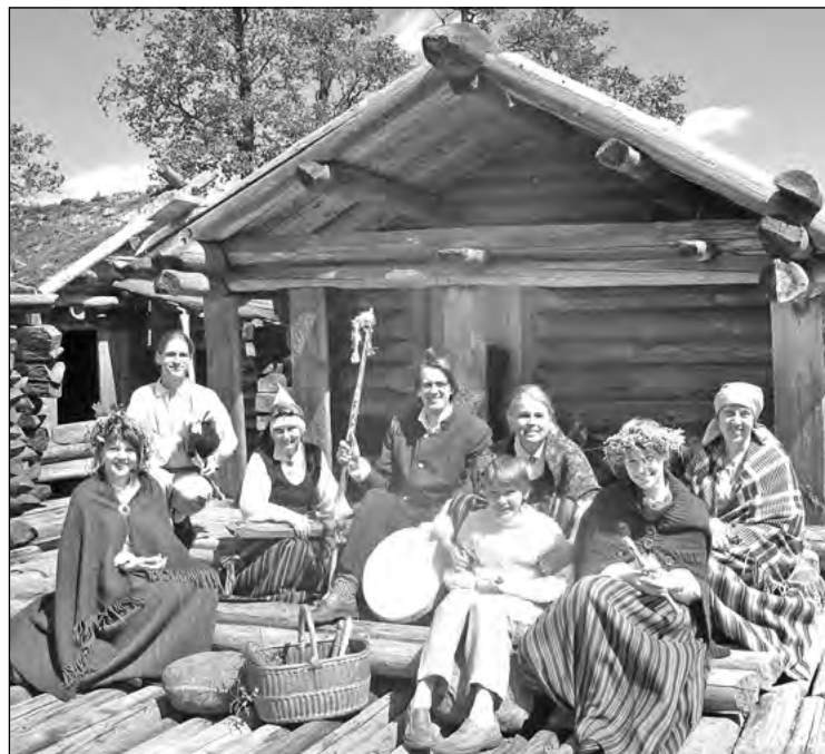
Dziēti Ezerpili.

Kopš decembra divas Ivara Aizkalna gleznas rotā arī Amatas novada domes priekšsēdētāja kabinetu.