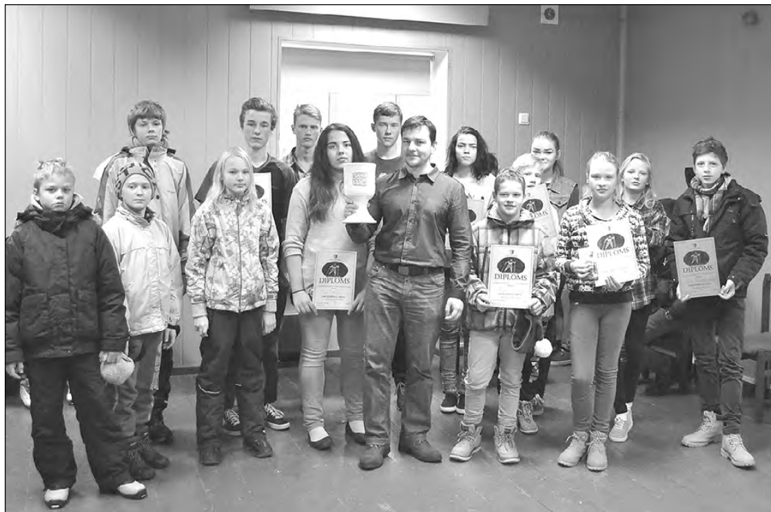
Sacensību uzvarētāji un Amatas pamatskolas direktors ar Lielo Sniega dienas kausu.

7. – 9.klašu grupā meitenēm 1500 m slēpojumā 1.vieta –