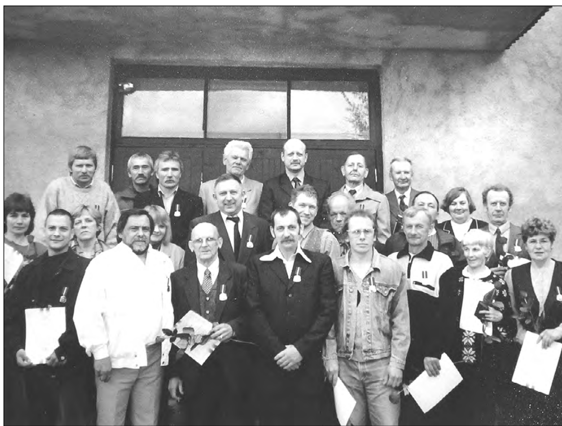
Barikāžu dalībnieki – nītaurieši.

Kādu nakti ar kolēģi dodamies apskatīt citas vietas. Netālu no Ministru Padomes novietots sašauts autobuss ar ložu atstātām pēdām. Rīgas centrs un Vecrīga pilni ar smago tehniku, dzelzsbetona blūkiem, visāda veida mantām, ar visu, kas apgrūtinātu tanku un bruņu mašīnu pārvietošanos. Vietējās vecmāmuļas nes pie uguns kuriem tēju, sviestmaizes. Daudzi nav gulējuši. Tiem ir iespējas ieiet netālo kinoteātru „Rīga” un „Spartaks” skatītāju zālēs uz krēsliem pagulēt. Atvērtas arī citas telpas, lai apsildītos un zem jumta atpūstos. Cauri barikādēm, pa šaurām spraugām aizklūstam līdz Doma laukumam. Tur tas pats skats. Doma baznīcā izvietots medicīniskās palīdzības punkts, uz soliņiem atpūšas cilvēki. Dzirdami rīkojumi, patriotisk-