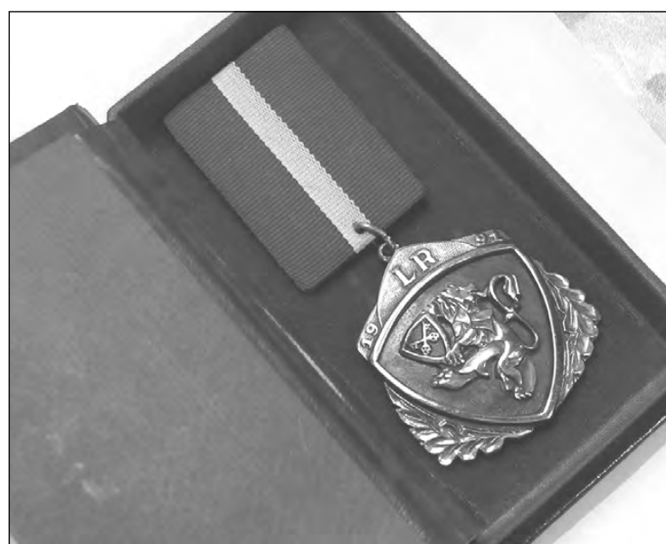
Barikāžu dalībnieka medaļa.

Diemžēl, kad vēlāk interesējos par barikāžu dalībnieku sarakstiem, atklājās, ka tie pazuduši. Ar domu biedru grupiņu un Līviju Ķauķīti mēģinājām