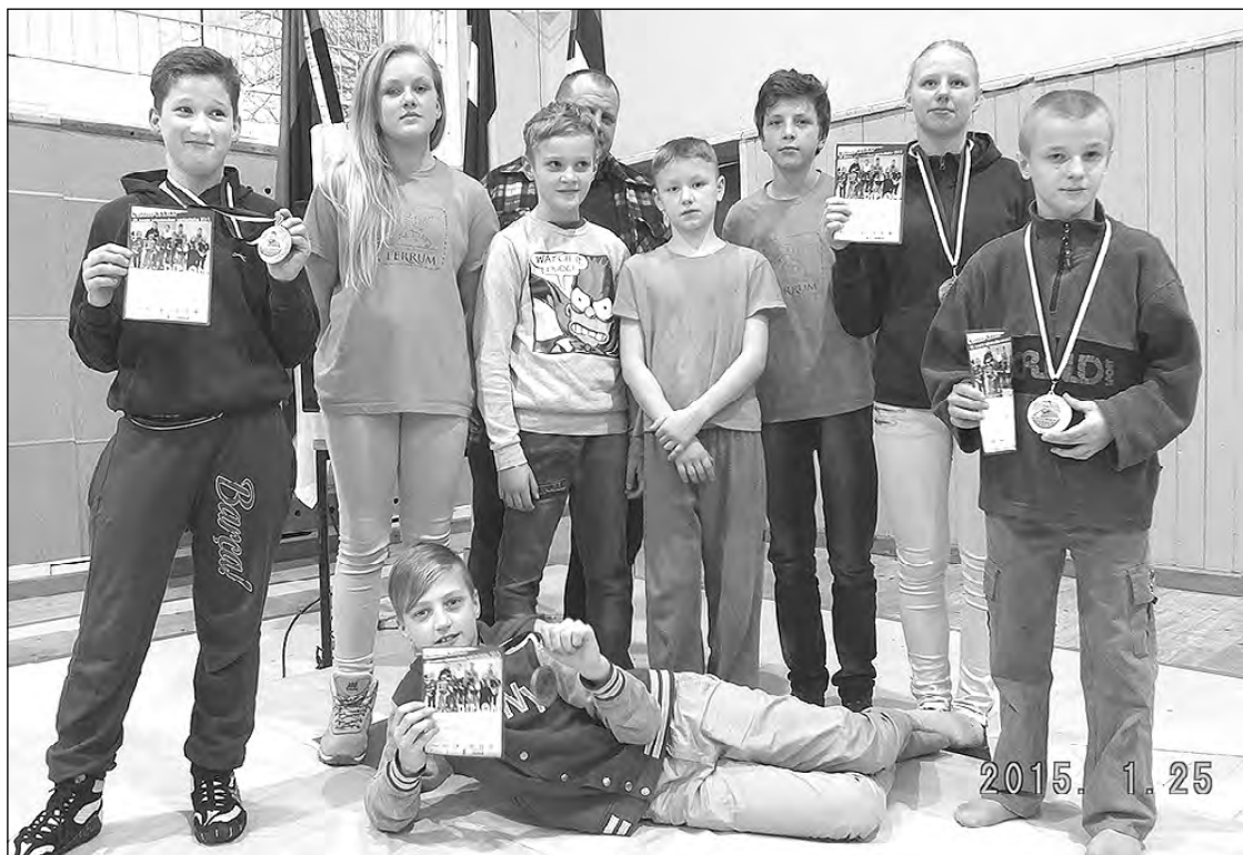
„Ferrum” komanda pēc sacensībām Igaunijā.

Kā CSK „Ferrum” kluba pārstāvji centīsimies Samantai šo iespēju nodrošināt cerot uz vietējo uzņēmēju un pašvaldību atbalstu nākotnē.