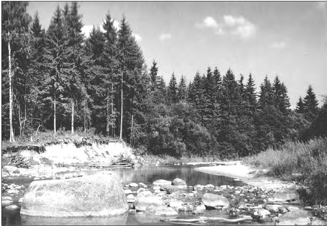
Amata 1963. gada vasarā.

Vecā ceļa malā Amata savos ievu ličos ik vasaru mitināja čigānus. Katru vasaru te baloja teltis, skanēja dziesmas un bērnu klaigas, kūpēja ugunskurs, smaržoja jēra zupa. Čigānu dzīve Amatas ličos man vienmēr likās pasakaini skaista