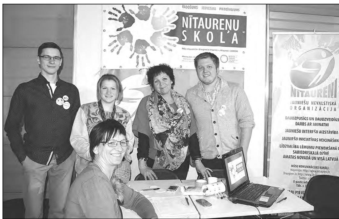
„Nītaureņu” dalība lielākajā Latvijas jauniešu NVO festivālā Ķīpsalā 24.martā.