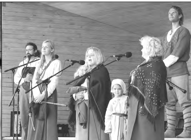
Foto no 2014. gada Amatas novada svētkiem Nītaurē