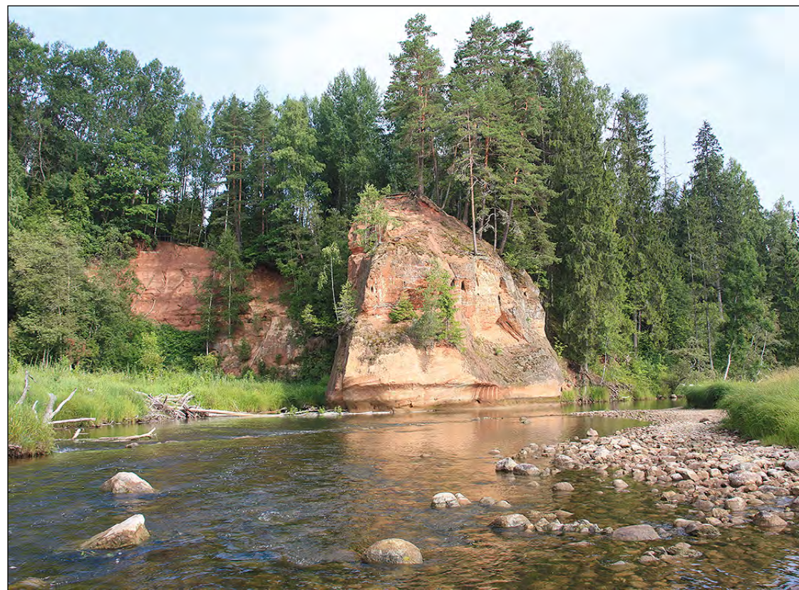
Zvārtes iezis.

Šogad tiks pabeigta spēlfilma „Melānijas hronika”, kas veltīta Melānijas Vanagas 110 gadu jubilejai. Gada nogalē būs pirmizrāde. Šobrīd vairākās valodās tiek tulkota M. Vanagas muzeja virtuālā ekspozīcija „Esi pats”.