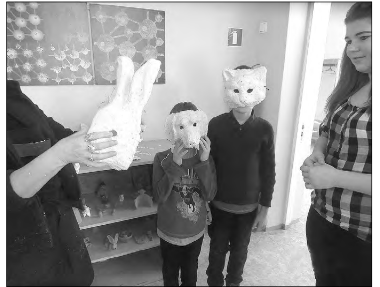
Nodarbības Pašgatavota papīra studijā.