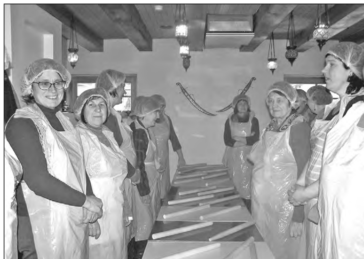
Amatu mājas rokdarbnieces kulinārijas stundā pie karājiem.

Ekskursijas ieguvumi ir vairāki. Vispirms, tā ir slavas dziesma leišu līnēm. Ja Latvijā lina audzēšana ir pabērna lomā un pārstrāde vispār iznīcināta, tad lietuvieši šo nozari attīstījuši un izkopi līdz pilnībai. Paņēvēšanas lina fabrikas veikalā atstājām lielu daļu braucienam paredzētās naudas, jo tik bagātu lina audumu un izstrādājumu klāstu nenākas bieži redzēt, aptaustīt, par to izpriecāties: no blīviem korda līdz smalkiem, gaisīgiem aizkaru un goda apģērbu audumiem, no vienkārtīga, smalka un gluda diega kamoliem līdz šķeterēta daudzkrāsaina lina pavedienu spolēm aušanai, dažādiem patiesi smalkiem rokdarbiem, turklāt par daudz zemākām