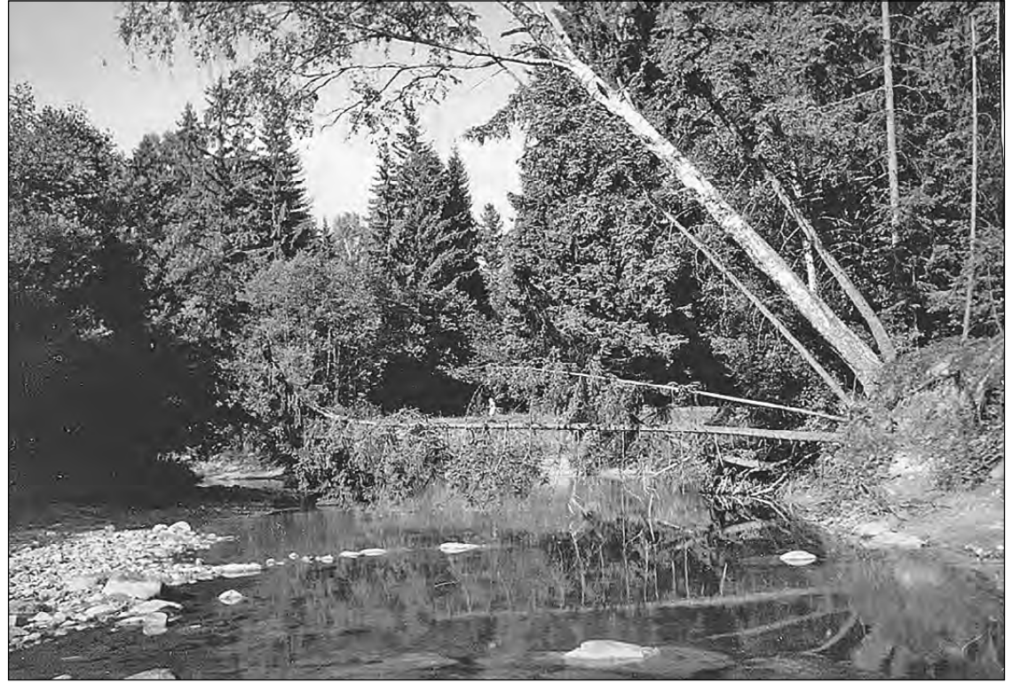
Amata 1963. gadā.

Mēness nodziest pavisam. Ugunskurs tik tikko elpo. No meža spiežas virsū kāds melns smagums. Arī pati pārvēros tumsā, kas slīd projām ar Amatas traumī. Kad aiztecešu visa, manis vairs nebūs. Saprotu, ja izspruks pār lūpām kaut viena nopūta, ka auksti vai nelabi, es... aiztecešu. Neizspruks! Acis kļūst aklas, toties ausis dzirdīgākas. Dzirdu, kā bezmiegs moka ne vienu vien koku, arī upe negul. Tagad vislabāki klausīties tikai upi. Upei ir ko stāstīt - par sevi, par Viņu, kas tā milēja Amatu. Es Amatai lūdzu atmiņas. Tās gaisās, saules aspidētās, ar kādām pašreiz atsperties pret tumsas spēku. Un upe sāk runāt ar manis pašas atmiņu balsi, un tumsa atkāpjas.