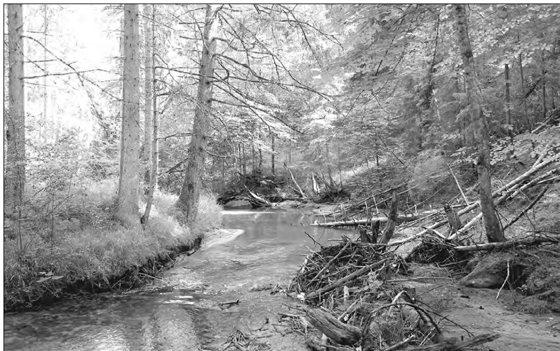
Amata augštecē.

Saule jau slidēja uz vakara pusi un krastā silti aspidēja kādas skumjas priedes auksto sakni. Saprātu, ka Mežamāte man ceļ krēslu atpūtai un metu nost mugursomu. Šodien nebija daudz noiets, bet daudz pārdzīvots, un smagā mugur-soma lauza muguru. Jutu lielu nogurumu. Un tikai tad ieraudzīju, ka uz saknes saritinājusies guļ kaparcūska. Tā arī atpūtās pēc dienas gaitām. Tā bija priedes mizas krāsā un saulē gandrīz caurspīdīga. No manis nemaz netaisījās bēgt, bet saritinājās vēl ciešāki un galvu pārlika pār kapara lokiem. Zināju, ka gaišās caurspīdīgās