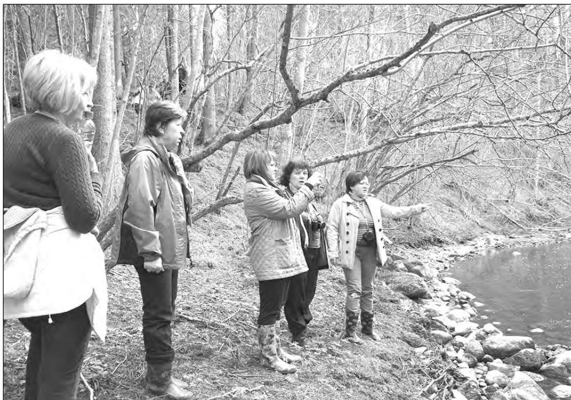
Amatas krastā pie Dolēm.