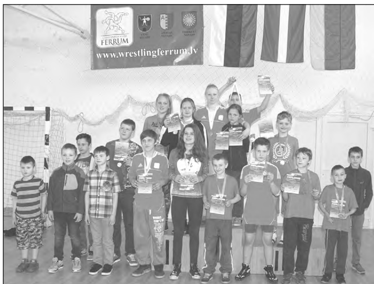
„Ferrum” komanda.