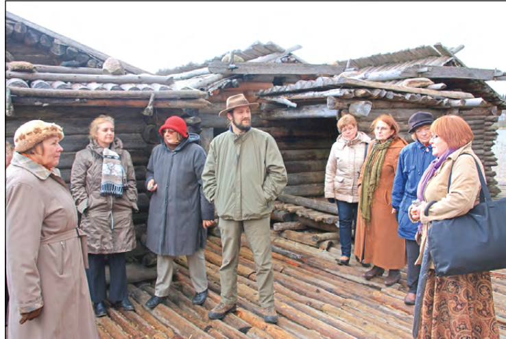
Foruma dalībnieki iepazīst Āraišu ezerpili.

Forums bija vērtīgs un saturiski kvalitatīvs un varēja ieraudzīt kopainu, pateicoties visiem, kuri bija klāt – sākot ar dažādo jomu speciālistiem, entuziastiem un beidzot ar pašiem āraišniekiem.