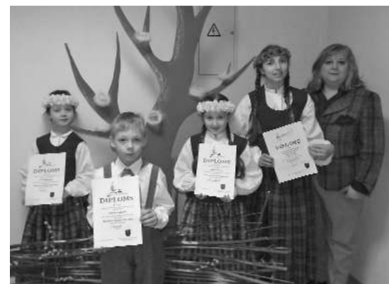
Фото: Участники фольклорного ансамбля Лудзенской городской гимназии

В Дрицанах выступили участники фольклорного ансамбля Лудзенской городской гимназии (рук. Илга Таукача) и фольклорного ансамбля