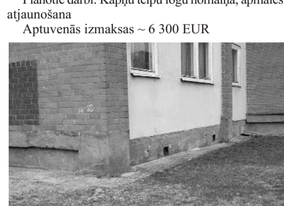
Foto: tā šobrīd izskatās mājas Raiņa ielā 53 apmale

Latgales ielā 30b Plānotie darbi: Kāpņu telpu kosmētiskais remonts