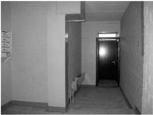
Foto: pirms un pēc kāpņu telpas remonta

Blaumaņa ielā 13 Plānotie darbi: Kāpņu telpu logu nomaiņa