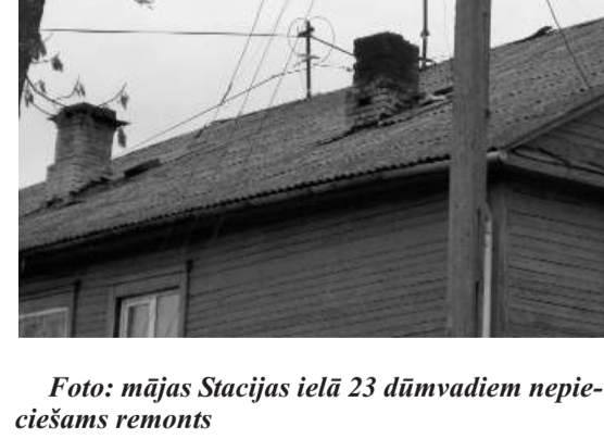
Foto: mājas Stacijas ielā 23 dūmvadiem nepieciešams remonts

Latgales ielā 240 Plānotie darbi: Dūmvadu remonts