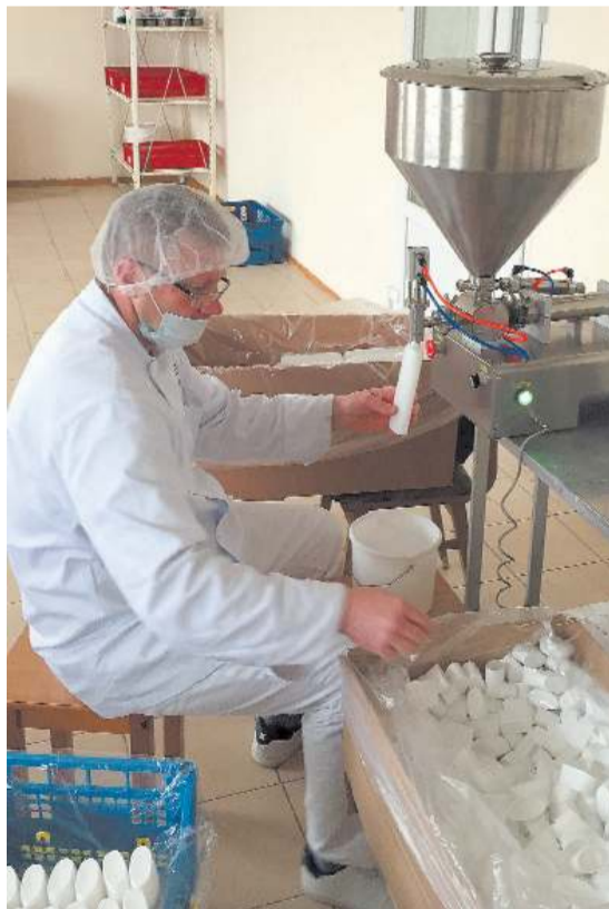
Foto: kosmētisko līdzekļu fasēšanas process

To, ka mūsu darbības vērtīgo vielu iegūšanas no peloīdiem jomā ir pareizas, apstiprina arī LU Mikrobioloģijas katedras trīs pētījumu gadu laikā izdarītie secinājumi, kas tika iegūti. Pētnieciskais darbs veikt, piesaistot citus speciālistus, īpaši no Latvijas Universitātes Ģeogrāfijas un Zemes zinātņu fakultātes un citām Latvijas Universitātes struktūrām, un izmantojot ES struktūrfondus.