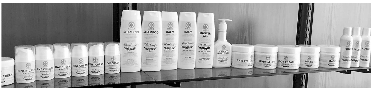
Фото: линейка косметических продуктов