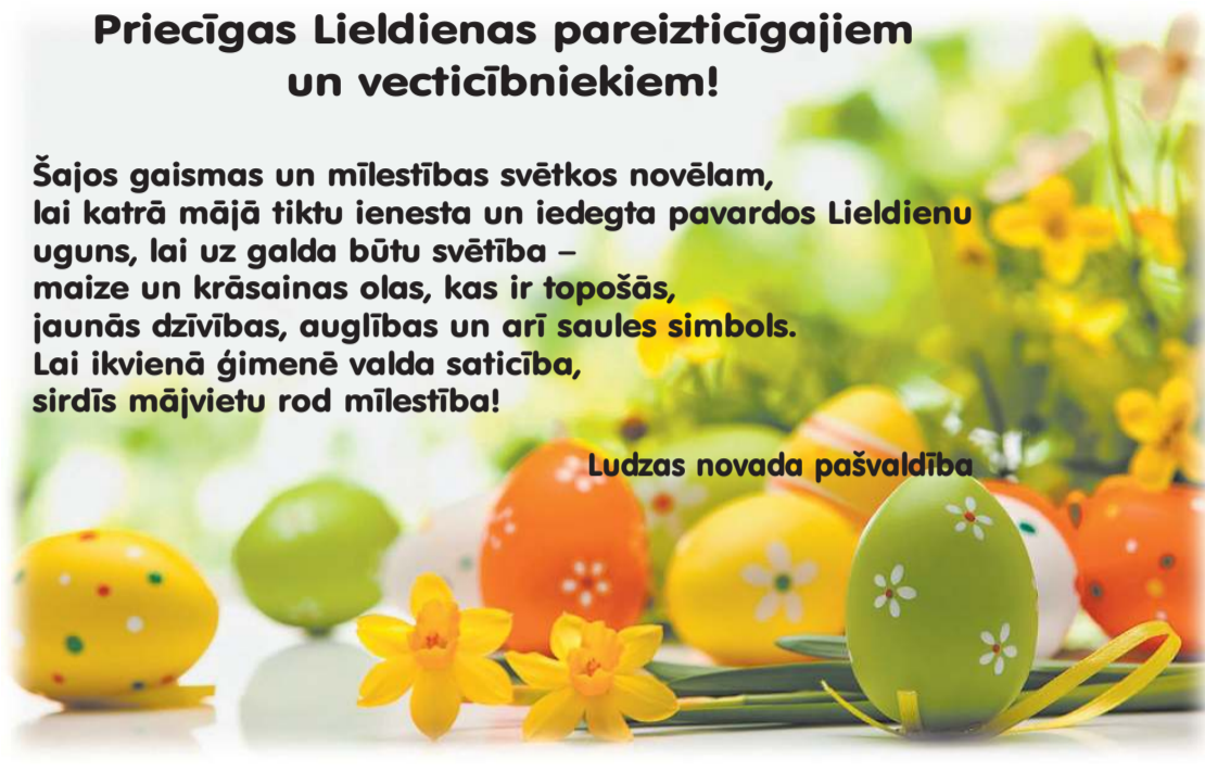
Ludzas novada pašvaldība

Šajos gaismas un mīlestības svētkos novēlam, lai katrā mājā tiktu ienesta un iedegta pavardos Lieldienu uguns, lai uz galda būtu svētība – maize un krāsainas olas, kas ir topošās, jaunās dzīvības, auglības un arī saules simbols. Lai ikvienā ģimenē valda saticība, sirdīs mājvietu rod mīlestība!