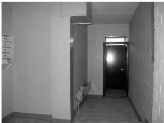
Фото: до и после косметического ремонта подъезда дома по улице Райня 32