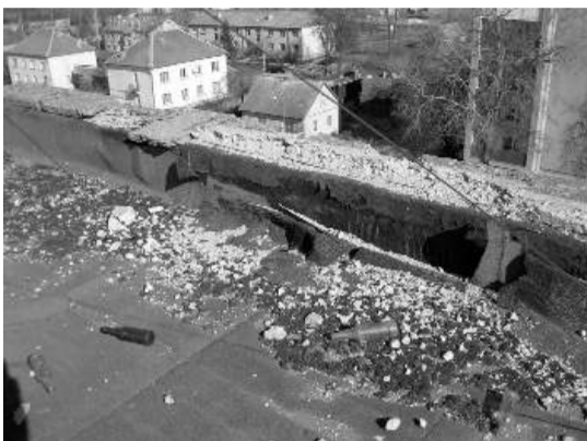
Foto: Mājas Liepājas ielā 21 jumts

Kopējās izmaksas: 12 252 EUR, pašvaldības līdzfinansējums – 6 000 EUR