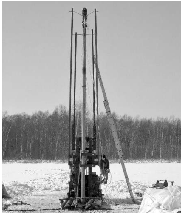
Фото: добыча сапропеля

Главное, что наш пелоидный комплекс, как ингредиент косметического средства, благоприятно влияет на иммунную систему кожи. Во всех наших