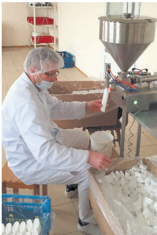
Фото: расфасовка продукции

Кажется, еще совсем недавно предприимчивый и дальновидный Евгений Лукашенко возобновил изыскание и изучение местных природных ресурсов: в озерах Лудзенского края наладили добычу сапропеля, или правильнее сказать – пелоидов.