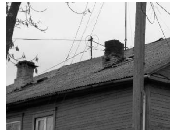
Фото: дымоходам дома по улице Стацияс 23 необходим ремонт