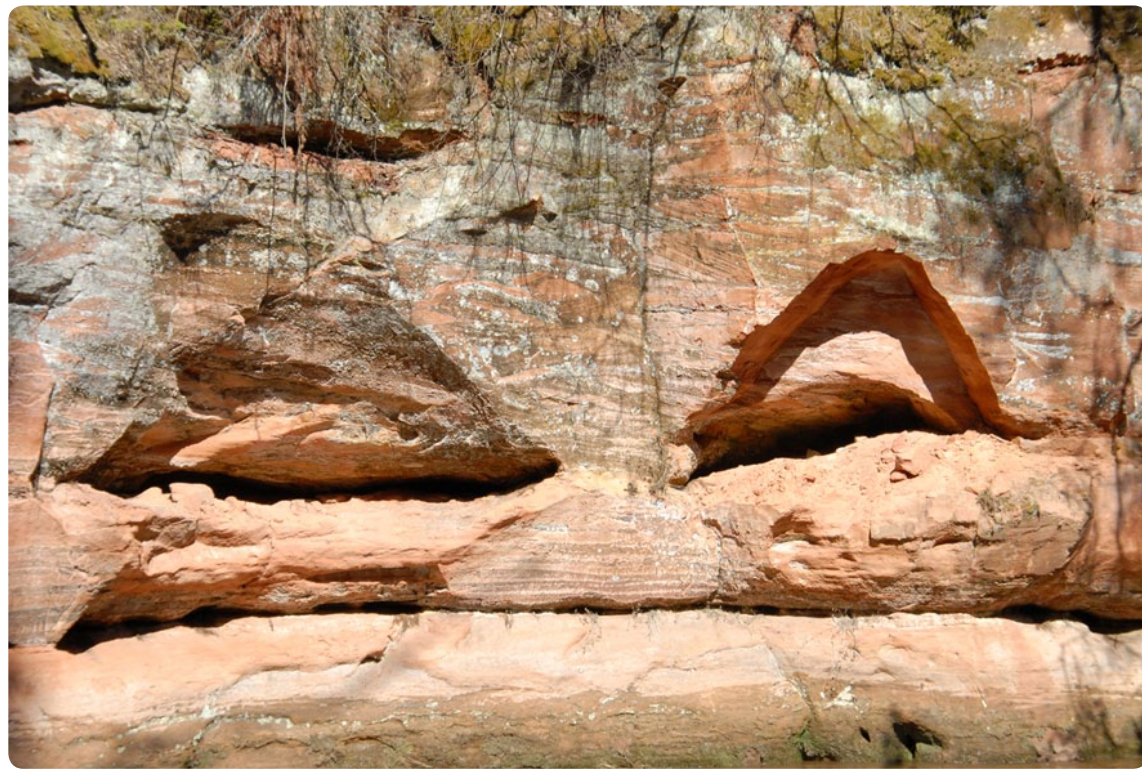
Foto: No laivošanas un pastaigām gar Amatas upi mūsdienās. Elīna Sofija Kalēja

krastam iekšējā likumā, kur mazāks straumes spēks. Tur bija egles galotne, kas iegāzusies piekrastes brikšņos. Mēs ar Birutu braucām otrie.