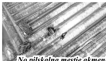
No pilskalna mestie akmeņi un ķieģeļi izsit caurumus ēku jumtos

Vai tiešām mēs pašu rokām saugsim senās pils mūrus, kuras