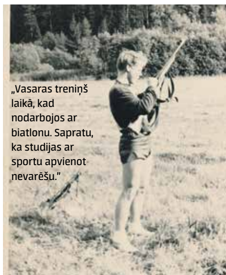
„Vasaras treniņš laikā, kad nodarbojos ar biatlonu. Sapratu, ka studijas ar sportu apvienot nevarēšu.”