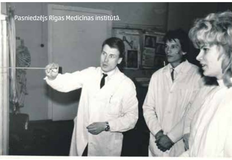
Pasniedzējs Rīgas Medicīnas institūtā.