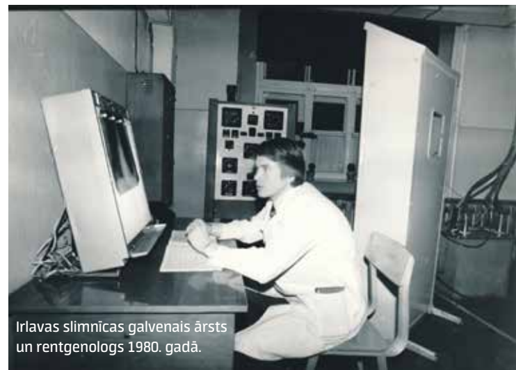
Irlavas slimnīcas galvenais ārsts un rentgenologs 1980. gadā.