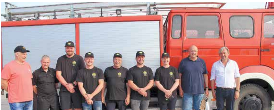
Kad auto ir nodots Tūjas brīvprātīgajiem ugunsdzēsējiem, laiks kopbildei.

Paldies SIA "Lauga" par ieguldījumu novada un pagasta drošības stiprināšanā. Brīvprātīgie ugunsdzēsēji ar atbildību pieņem uzņēmēja dāvināto ugunsdzēsēju mašīnu. LAV