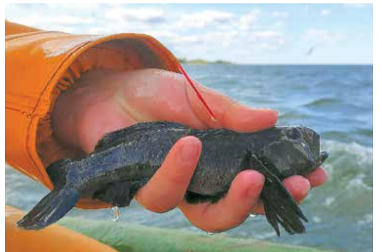
Šādi izskatās "marķētie" jūras grunduli.

"LIFE REEF" projekta laikā Baltijas jūras akvatorijā plānots kartēt un izpētīt Eiropas Savienības nozīmes īpaši aizsargājamās jūras biotopus "Smiltis sēkli jūrā" un