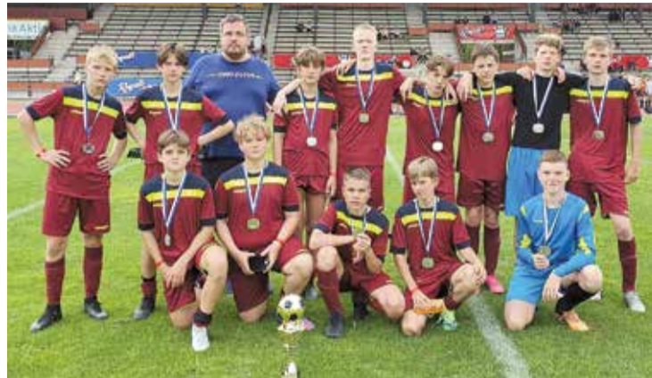
Mūsu futbolisti Somijā.

Veiksmīgāk veicās mūsu U-11 vecuma komandai, kuras grupā spēlēja 30 komandas, sadalītas 10 apakšgrupās. Savā apakšgrupā Limbažu novada Sporta skolas komanda izcīnīja vienu uzvaru un piedzīvoja vienu zaudējumu. Diemžēl zaudējums piedzīvots arī astotdaļfināla mačā. Galarezultātā komanda ierindojās 15. vietā.