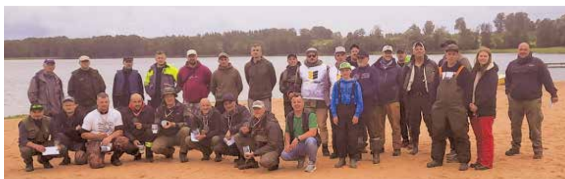
Sacensības veiksmīgi noslēgušās.