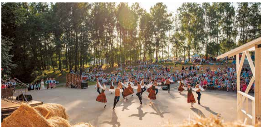
Svētkos netrūka ne dejotāju ne skatītāju! Paldies par jaukajiem svētkiem!

Valsts izglītības satura centra Neformālās izglītības departamenta vadītāja Agra Bērziņa pateicās Limbažu novada pašvaldībai par bērnu deju festivāla organizēšanu un radīto svētku