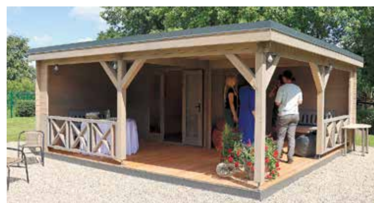
Vilzēnos grāmatas tagad var lasīt arī āra lasītavā.

SIA “Timbero Latvia” ne vien izgatavoja un uzbūvēja āra lasītavu, bet arī ziedoja daļu materiālu un dāvināja sēžamamaisus. Reinis