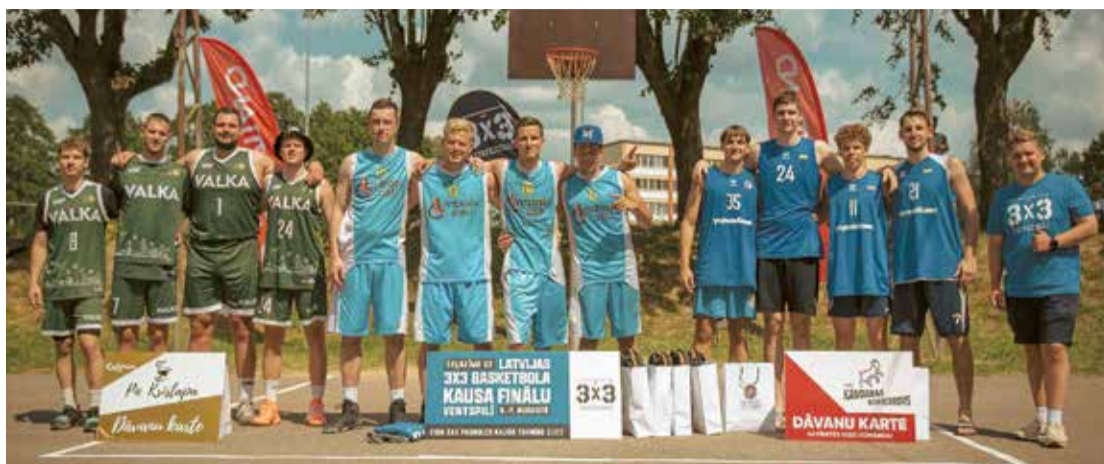
Sacensību uzvarētāju kopbilde.