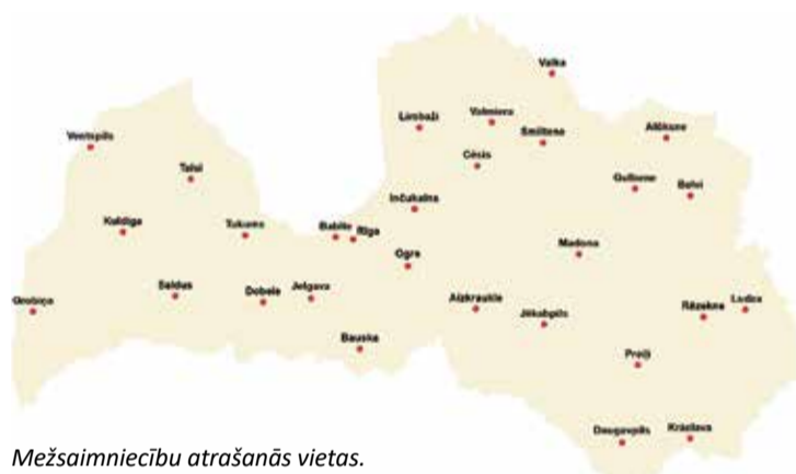
Mežsaimniecību atrašanās vietas.

Valsts meža dienestam adresētos iesniegumus var iesniegt: - tiešsaistē Meža valsts reģistrā;