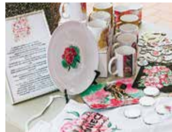
Šajos svētkos peonijas bija vāzēs, uz krūzītēm, auduma, gleznās un fotogrāfijās...

18. jūnijā Burtnieku kvartālā Limbažos ikviens tika aicināts svinēt krāšņos Peoniju svētkus.