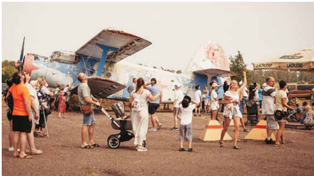
Šajā svētku reizē visvairāk un ilgāk bija jāskatās augšup.