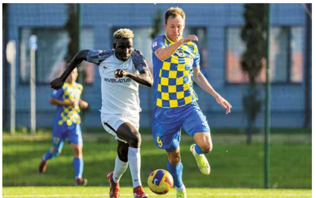
Optibet Virslīgas spēlē Salaspils stadionā 20. augustā.

Nākamā spēle notiks 27. augustā plkst. 14.00 Jāņa Daliņa stadionā Valmierā, kad “Super Nova” tiksies ar “Valmiera FC”. Salaspils stadionā spēles notiks 4. septembrī plkst. 16.00, “Super Novai” tiekoties ar FK “Metta”, un 11. septembrī plkst. 16.00, - tiekoties ar FK “Liepāja”. 18. septembrī plkst. 16.00 Skonto stadionā “Super Nova” tiksies ar FK “Auda”, bet 30. septembrī plkst. 18.00 Salaspils stadionā – ar “Rīga FC”.