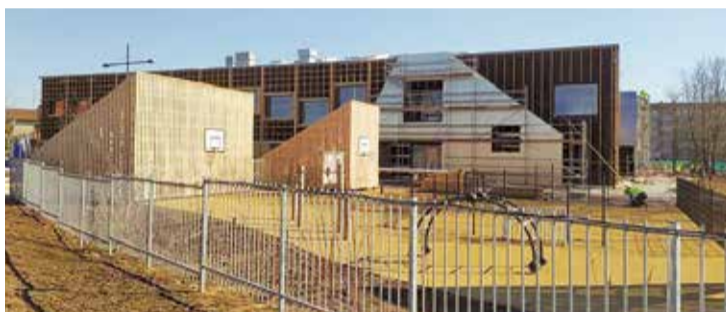
Būvniecībā esošā Septītā pirmsskolas izglītības iestāde.

Būvkompanija "Merks" apgalvo, ka būvprojekts ir nepilnīgs un kļūdainais, kas it kā bijis par iemeslu būvdarbu savlaicīgai neizpildei, taču būvuzņēmējs nav iesniedzis vai norādījis nevienu konkrētu dokumentu, kas dotu objektīvu apstiprinājumu šādam apgalvojumam. Savukārt Salaspils pašvaldības pieaicinātais būvprojekta ekspertīzes veicējs – SIA "Cerkazi G" – atspēko būvkompanijas "Merks" paustos apgalvojumus par būvprojekta nepilnībām. 2022. gada 7. jūlijā Salaspils pašvaldība nosūtīja vēstuli ar ekspertu slēdzieni būvkompanijai "Merks".