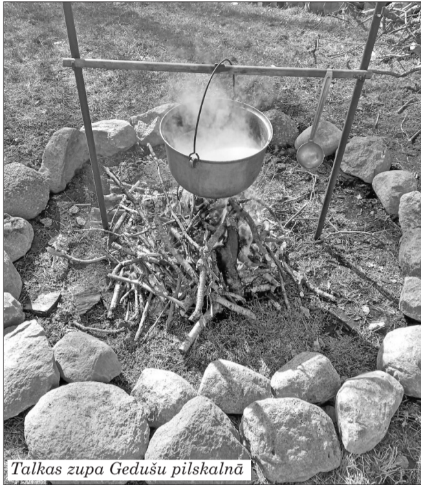
Talkas zupa Gedušu pilskalnā

Turku pagastā šogad plānots atdzīvināt Gedušu pilskalnu. Pilskalnā tika organizēta talka, sakopjot apkārtni un ierīkojot ugunsкура vietu. Maijā uz pilskalna kopā ar folkloras kopu "Turki" notika pasākums "Lakstīgalu nakts". Atrdoties Gedušu pilskalnā var sajūst šīs vietas īpašo auru. Gedušu pilskalnā pieejama arī publiska ugunsкура vieta, ko aicināti izmantot piknika cienītāji. Iespēja palikt pilskalnā ar telti nav liegta nevienam gribētājam.