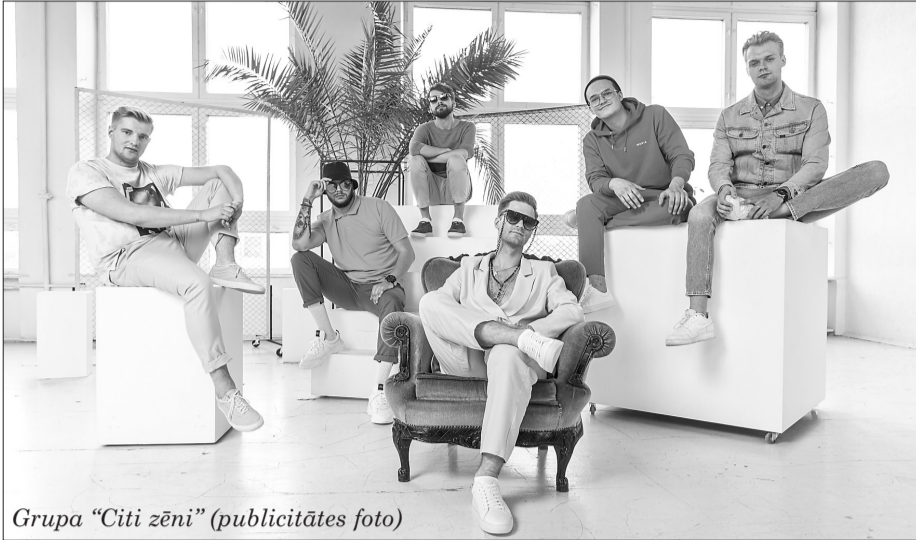
Grupa “Citi zēni” (publicitātes foto)

No plkst. 10:00 savu labāko produkciju piedāvās amatnieki, mājražotāji un citi tirgotāji. Mēs iepirkšanās svētku tirdziņā un pastaigas pilsētā, vislabākā