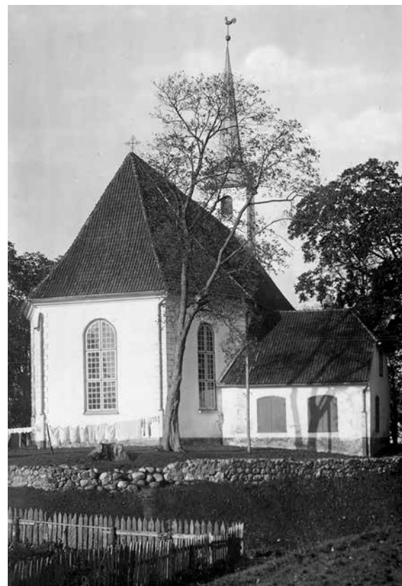
Limbažu ev.-lut. baznīca no sakristejas puses. Priekšplānā sakņu dārziņa sēta.

Juris Pavlovičs, Limbažu muzeja vēsturnieks