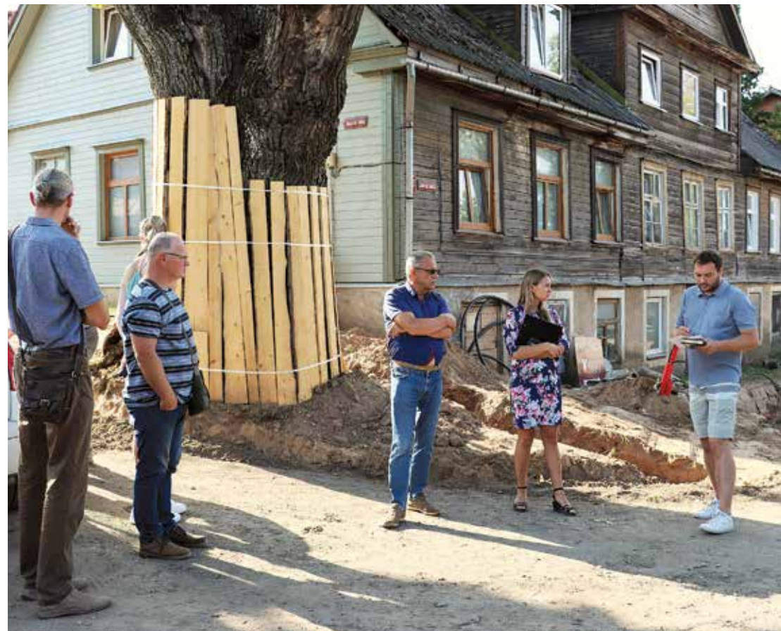
Būvsapulce Jūras ielā.

Aktīvi noris Limbažu Jūras ielas pārbūves darbi. Tiek strādāts pie lietus ūdens kanalizācijas un ūdens tīklu izbūves. Šobrīd pārbūve notiek no Limbažu levu ielas rotācijas apļa līdz Dārza ielai.