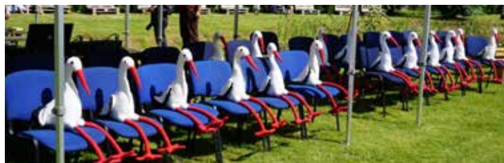
Īpaši šai dienai gatavotie stārķi gaida savus mazos staiceiliešus.