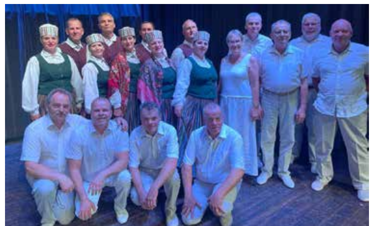
Limbažnieki pasaules folkloras festivālā Polijā.

No 28. jūlija līdz 3. augustam VPK "Savieši" un ansamblis "Dziļezers" piedalījās 9. Pasaules folkloras festivālā "Fathers Village" Polijā. Ielūgumu "Savieši" saņēma jau pirms diviem gadiem, bet toreiz visu izjauca pandēmija.