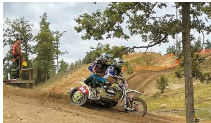
Sacensību mirklis amatieru čempionātā motokrosā.

Edgars Jurčenoks 1. braucienā diemžēl krita, kā rezultātā motociklam radās defekts, un arī 2. braucienā piedzīvots kritiens,