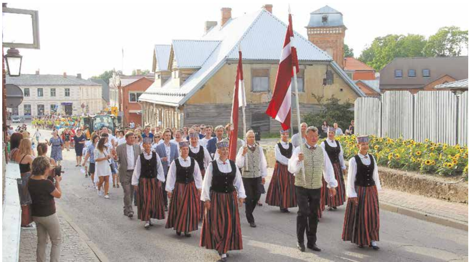
Piektdienas vakarā Limbažus pieskandināja pilsētas svētku gājiens.

Kā ierasts, par “oficiālo” svētku sākumu kļuva tradicionālais svētku gājiens, kurā piedalījās un sevi pārstāvēja Limbažu un novada uzņēmumi, interešu klubi, kultūras iestādes, skolas, deju kolektīvi un citi. Katrs gājiena dalībnieks radīja svētku sajūtu un atmosfēru. Paldies ik-