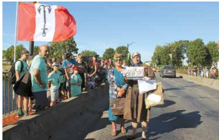
Olgs un Alms uz Salacas tilta paziņo krastu maču rezultātu.

Krasta mača organizētāji, spēlētāji, līdzjutēji saka lielu paldies Limbažu novada pašvaldībai, sporta un atpūtas kompleksam "Zvejnieku parks", Salacgrīvas kultūras centram, Olimpiskajam centram "Limbaži" par sadarbību pasākuma norisē. Paldies par balvām spēlētājiem un skatītājiem: "KaTe", "ab initio", Kui-