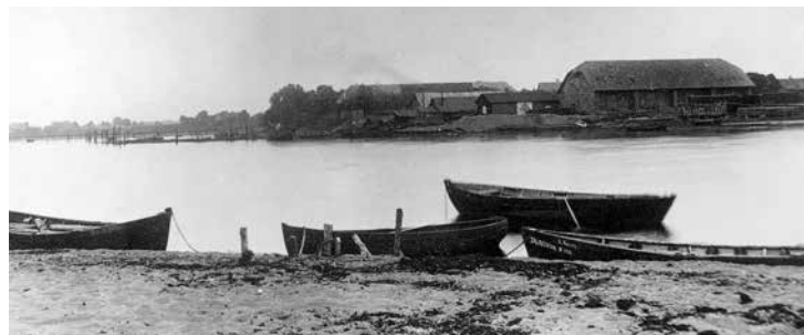
Salaca pie Salacgrīvas. 1920. - 1930. gadi.

1623. gada 30. septembrī Zviedrijas karalis Gustavs II Ādolfo atļāva jūras ostas tiesības zviedru Baltijā tikai trim pilsētām – Rīgai, Rēvelei un Pērnavai. Jau tā gadsimtu gaitā panīkusī Salacgrīva turpmāk varēja būt tikai laivu osta. Kad 1645. gadā zviedri ieguva Sāmsalu, Pērnavā kļuva par plašas apkārtnes tir-