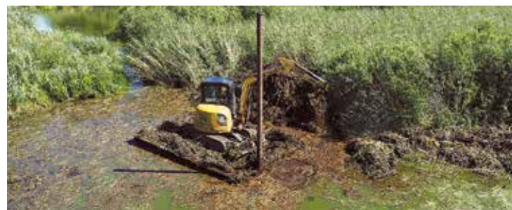
Tīrīšanas darbi Dūņezērā.

Limbažu novada pašvaldība 2021. gada 16. augustā noslēdza līgumu ar Valsts reģionālās attīstības aģentūru par projekta "Limbažu Dūņezera ūdensaugu aizauguma samazināšanas 2. kārtā" īstenošanu saskaņā ar noteiktajiem sugu dzīvotņu un biotopu apsaimniekošanas pasākumiem Dabas aizsardzības plānā un īpaši aizsargājamajā dabas teritorijā, dabas liegumā "Dūņezers".