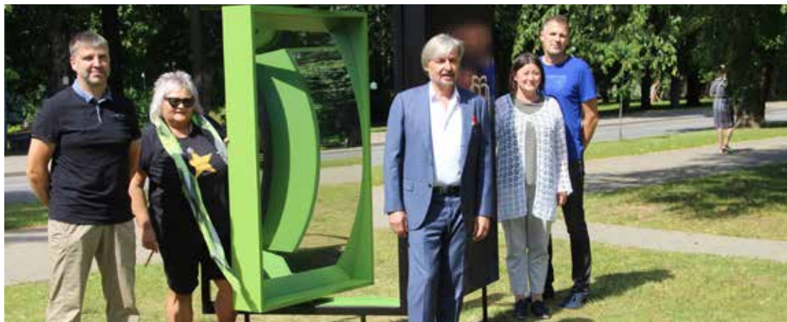
Pie vides objekta pilsētas centrā šoreiz fotografējas pašvaldības vadītājs, objekta idejas autores un projekta īstenotāji.