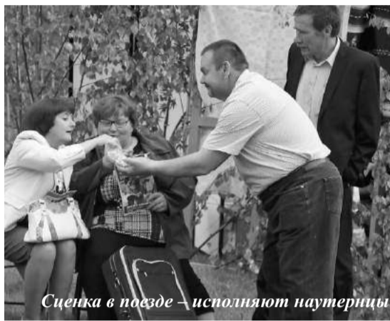
Сценка в поезде – исполняют наутерницы

Доставили радость зрителям гости из соседнего края: самодеятельные актеры из Наутренской