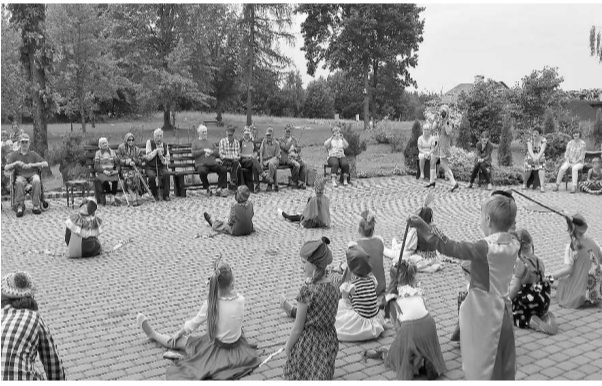
Mazo žonglieru dejas fināls dārza svētkos SAC „Ludza“

Nav noslēpums, ka mūsdienu sabiedrībā un daudz sasāpējušu problēmu – dzīvojam steidzīgā, stresa pilnā laikmetā, esam pieraduši, ka dažādas sabiedrības grupas un paaudzes norobežojas viena no otras, daudz retāk radoši izpaužamies un daudz neveselīgāk dzīvojam. Lai bērniem un viņu vecākiem parādītu ceļu uz mierīgu, atvērtu, kustīgu, veselīgu un radošu ikdienu, Ludzas novada Bērnu un jauniešu centrs (BJC) ar Ludzas novada pašvaldības finansiālu atbalstu jūnijā organizēja vasaras radošo darbnīcu "Iepriecini, un tev būs priecīgāk". Darbnīcai bija radoši – mākslinieciska un sociāli terapeitiska ievirze un tā notika 5 dienu garumā (š.g. 15. - 17. jūnijā un 20. - 21. jūnijā).