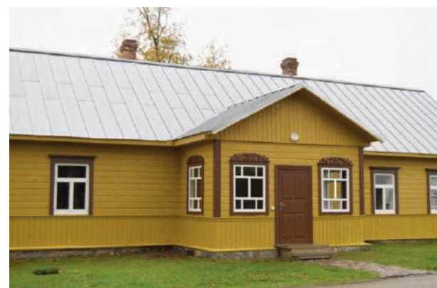
Jaunsaimnieka māja pēc labiekārtošanas darbiem, 2016.gads

Ludzas Novadpētniecības muzeja direktore