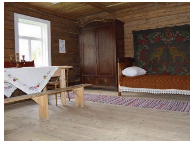
Ekspozīcijas “...bet sirdī visu mūžu nesu saules dienu, no tēva mājas mīļās pasaules” interjers