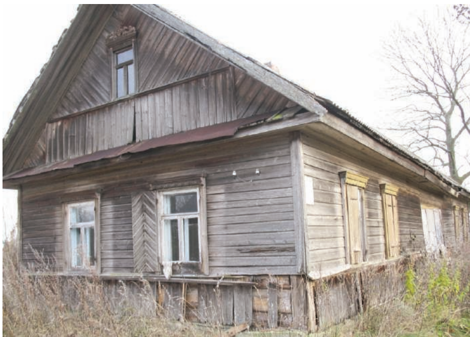
Дом в с. Авиши, Пушмуцовская волость, 2008 год.