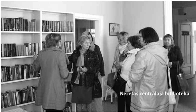
Neretas centrālā bibliotēka

24. aprīlī, Bibliotēku nedēļas ietvaros, kas visā Latvijā tiek atzīmēti aprīļa vidū, jau trešo gadu, Ilūkstes novada bibliotekāri un arī skolu bibliotēku darbinieki, brauca profesionālās pieredzes apmaiņas braucienos pie citu novadu bibliotekāriem, lai gūtu jaunas idejas un ierosmes turpmākajam darbam. Šoreiz mēs braucām pie Neretas novada bibliotekāriem.