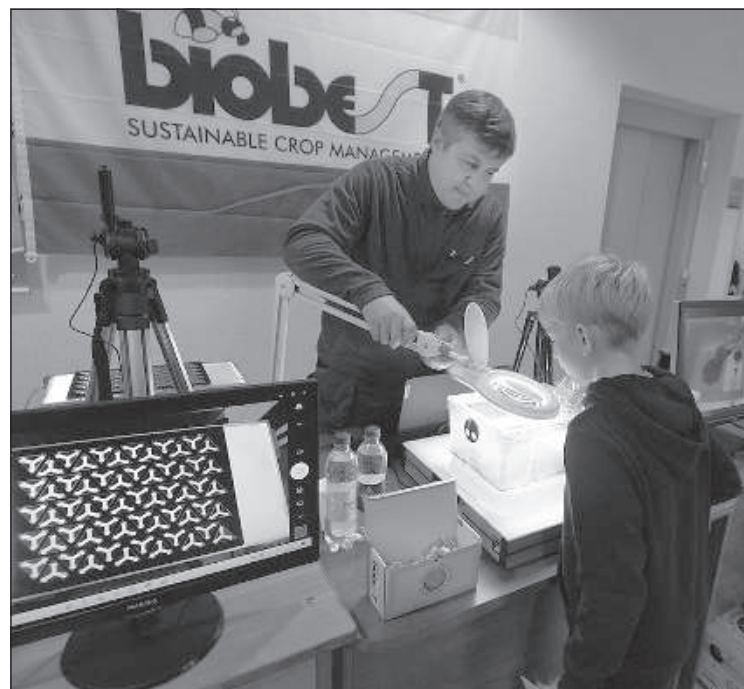
Познакомиться с жизнью в шмелином улье.