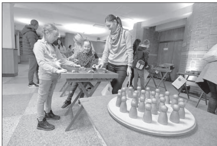
Во время мероприятия можно было поиграть в настольные игры.

В минувшую пятницу в корпусах Даугавпилсского университета по адресам Парадес 1 и 1А прошли традиционные мероприятия Европейской ночи ученых, темой которых в этом году была «Инновационная культура и творческое лидерство». Как сказали «Латгалес Лайкс» сами организаторы, мероприятие, организованное после двухлетнего перерыва, вызвало неожиданно большой интерес среди посетителей.