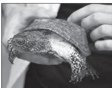
Поздороваться с болотной черепахой.

Любознательные жители имели возможность послушать музыкальные номера, принять участие в интерактивных занятиях, творческих мастерских, интеллектуальных играх, понаблюдать за различными демонстрациями, послушать рассказы ловца жуков, выделить ДНК, увидеть современное лабораторное оборудование, познакомиться с жизнью в шмелином улье, поздороваться с болотной черепахой, провести настоящие эксперименты и исследования, познакомившись со всеми отраслями науки, представленными в Даугавпилсском университете.