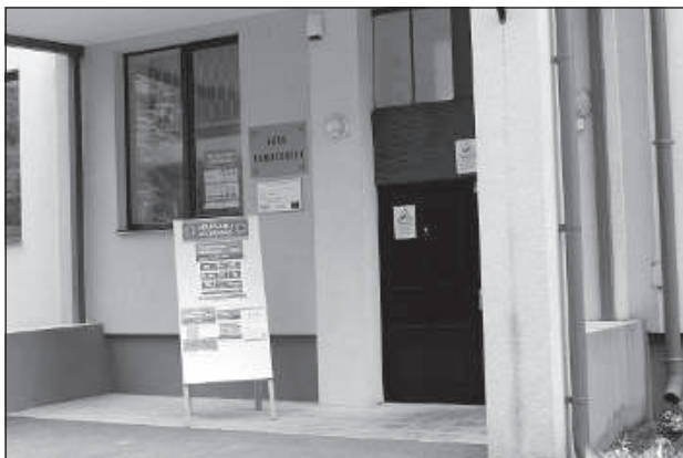
В крае работали 30 участков

1 октября по всей стране прошли выборы в 14-й Сейм. В этот раз явка по всем регионам была выше, нежели четыре года назад. Не исключением стал и Аугшдаугавский край, где проголосовали за своих кандидатов чуть более 52%. Четыре года назад в Даугавпилском крае всего проголосовали 35,90%, а в Илукстском – 45,99%.