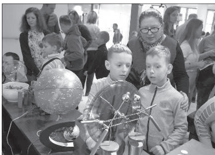
Проводить настоящие эксперименты.

в Даугавпилсе», которое организуется с целью содействия популяризации науки и инноваций в обществе с участием детей, молодежи и их родителей,