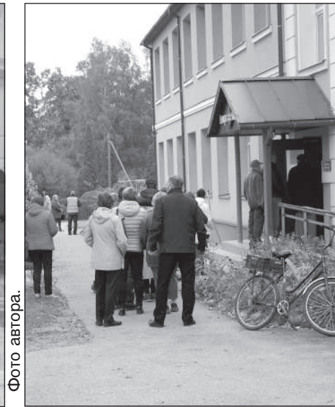
Очереди стояли на многих участках края.

о Латгалии, то в этот раз явка составила 57,14%. В 2018 году она была ниже — 43,40%. Если же говорить о фаворитах латгальцев, то они те же, что и в Аугшдаугавском крае, отличаются лишь проценты. Так, «Stabilitātei!» заработала 18,56%, «Zaļo un Zemnieku savienība» – 14,54%, а «Saskaņa» – 11,47%.