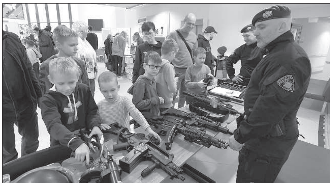
Посмотреть полицейское вооружение.