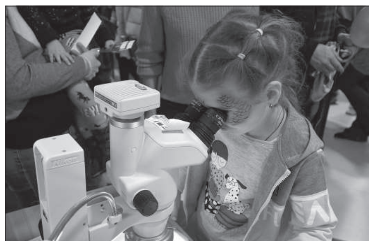
Провести собственные исследования.