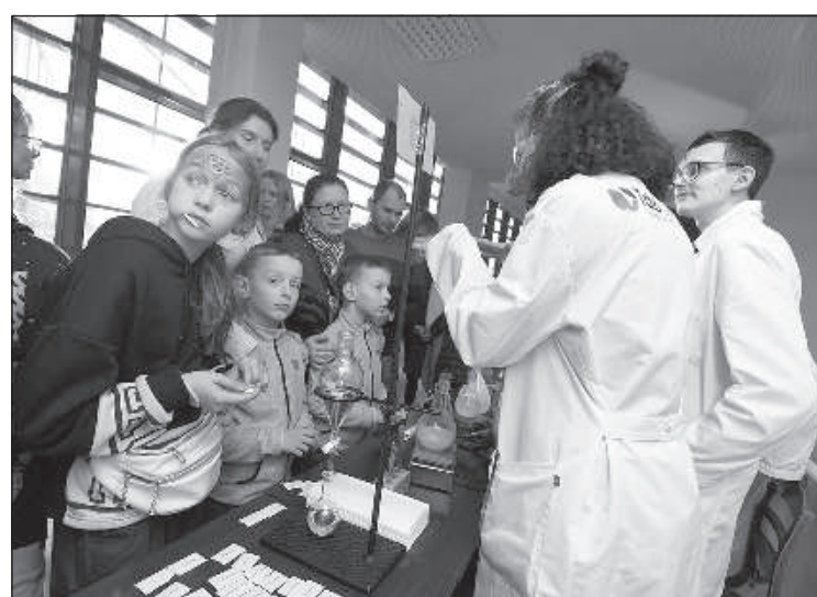
Наблюдать за различными демонстрациями.

а также акцентировать внимание на различных научных процессах, объясняя их в понятной и привлекательной для всех форме.