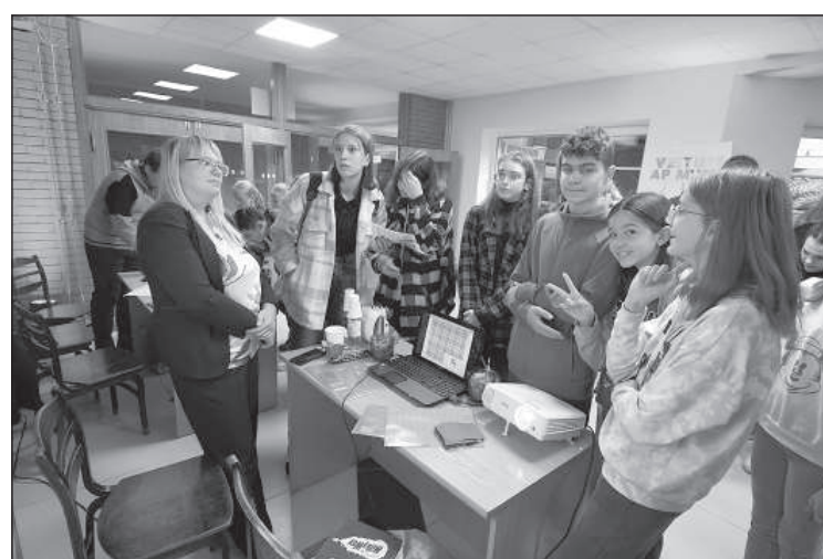
Поучаствовать в интерактивных уроках.

Проект «Создание инновационного центра в Даугавпилсе» реализуется в рамках программы «Исследования и образование» финан-