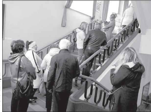
Очередь на избирательном участке.

Состав следующего Сейма стал известен Цен-