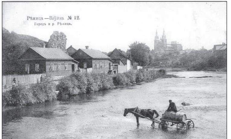
Река красивая и полезная.

дей. [...] На берегу реки можно видеть указатели, где купаться разрешено, а где нет. Это очень хорошо. Однако на некоторых граждан эти надписи совершенно не влияют, и они в местах для купания разрешают плавать своим собакам, лошадям и моют коров. В некоторых местах берега реки очень грязные». 8