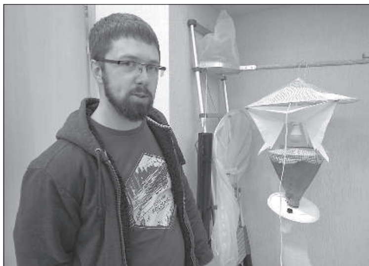
Послушать истории ловца жуков.

Ночь ученых является одним из мероприятий проекта «Создание инновационного центра