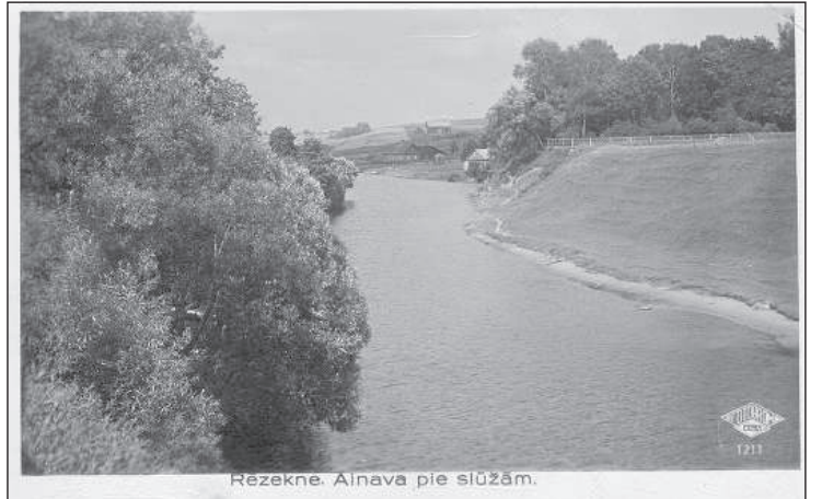
Перед мельницей Лещинского.