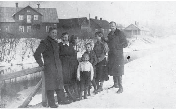
Воспитанники Выпингской школы (1942) напротив дома на нынешней улице Краста, 37.

Только после Второй мировой войны в Резекне было организовано централизованное водоснабжение. 5 До этого мно-