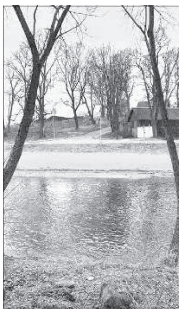
Конец улицы Дзирнаву.

гие горожане брали воду из реки, чтобы пить и готовить.