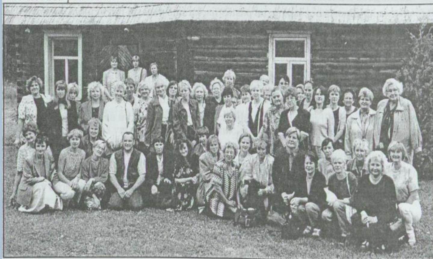
Latvijas tautas bibliotēku 7. Novadpētniecības konferences dalībnieki pie bīskapa Valerjana Zantaka dzimtās mājas.

Balvu novada mūs gaida iepazīšanās ar ļoti daudziem izcīnītiem novadpētniekiem — sava novada patriotiem un novadniekiem, ieskats Balvu novadā.