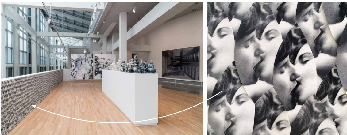
Karmena Vinante ( Carmen Winant ). Atbilde ir matriarhāts. Fotokolāža, 2017.

Karmena Vinante ( Carmen Winant , 1983) – rakstniece un vizuālā māksliniece. Pieejams: https://carmenwinant.com/Gradient Projects ; https://gradientprojects.org/2017/06/28/carmen-winant-the-answer-is-matriarchy-2016-greymatters-wexarts/