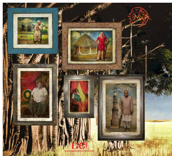
Wiruchi12345. Mans ģimenes koks. 2014.

Hansa Vilema fon Plettenberga un viņa ģimenes portrets. 1750.–1774. Pieejams: https://commons.wikimedia.org/wiki/File:Portrait_of_Hans_Willem_van_Plettenberg_and_his_family.jpg