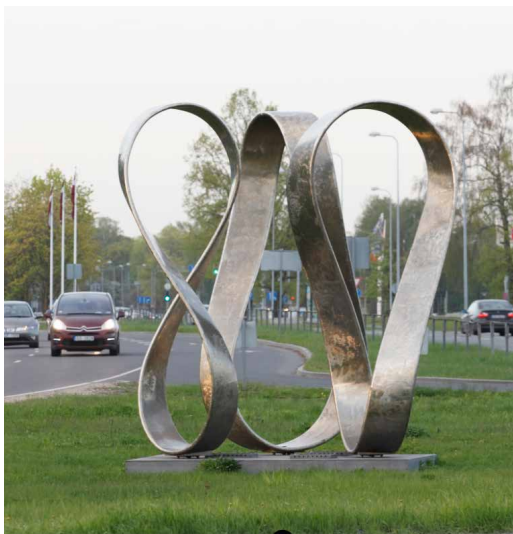
Rīga 800: vides instalācija.

Pieejams: https://www.rigaspieminekli.lv/?lapa=piemineklis&zanrs=6&rajons=6&id=40