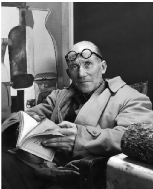
Lekorbizjē (1887–1965). Īstajā vārdā – Šarls Eduārs Žanerē Grī.