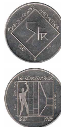
5 franku monēta. Pieejams: https://lv.ucoin.net/coin/switzerland-5-francs-1987/?ucid=19685330

Le Korbizjē (Le Corbusier) – unikāls autors, Šveicē dzimis franču arhitekts, pedagogs, zinātnieks, mākslinieks, pieticīgs un vienkāršs cilvēks, viens no modernisma arhitektūras nozīmīgākajiem pārstāvjiem.