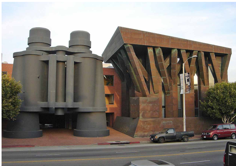
Klāss Oldenburgs.